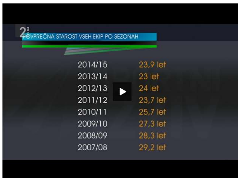
Slika 8: Povprečje starosti igralcev prve košarkarske lige

Ena od prelomnih sezon je bila sezona 2010/2011 , ko je v 1. SKL nastopalo samo 11 moštev (od tega kar 4 ekipe iz Savinjske regije: Zlatorog Laško, Hopsi Polzela, Elektra Šoštanj ter Šentjur). Ker v tej sezoni iz 1. SKL ni izpadel noben klub, so si trenerji upali več priložnosti ponuditi mlajšim domačim košarkarjem, kar pa se je poznalo pri sestavi moštev. Povprečna starost igralcev 1. SKL je s 27,3 padla na 25,7 let. Povod udejstvovanja mladih igralcev je bila tudi finančna kriza, ker klubi niso imeli denarja za nakup kakovostnih tujcev (Bašelj, 2014).