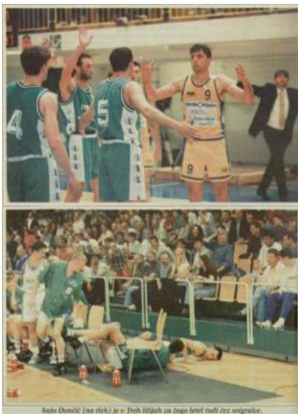
Slika 5: Izenačeni polfinale DP 1996/97, Savinjska Polzela : Pivovarna Laško

V finalu, kjer so se Polzelani srečali z ljubljansko Olimpijo, je prvi dve tekmi dobila Olimpija. Na tretji tekmi v Ljubljani, ko je bilo že vse pripravljeno za veliko slavo domačinov ob novi osvojitvi naslova državnih prvakov, pa so presenetili Polzelani in premagali Ljubljančane za 10 točk. Na četrti tekmi na Polzeli je Olimpija postavila stvari na svoje mesto in zaslužno slavila naslov državnih prvakov, Polzelani so v svojo vitrino postavili še drugi naziv državnih podprvakov . Letošnja sezona se je zatorej zdela celo uspešnejša kot lanska. Lani so Polzelani osvojili edino lovoriko, toda to leto so se dokazali v Evropi, se udeležili obeh finalov in enkrat celo premagali Olimpijo. Ponovno so storili vsaj pol koraka naprej. Finale državnega prvenstva pa ni bil izenačen toliko po njihovi zaslugi, marveč zaradi dejstva, da je Olimpija po sijajni evropski sezoni bila zelo izčrpana (Lukač, 15. 5. 1997).