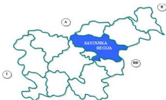
Slika 2: Prikaz Savinjske regije v Sloveniji