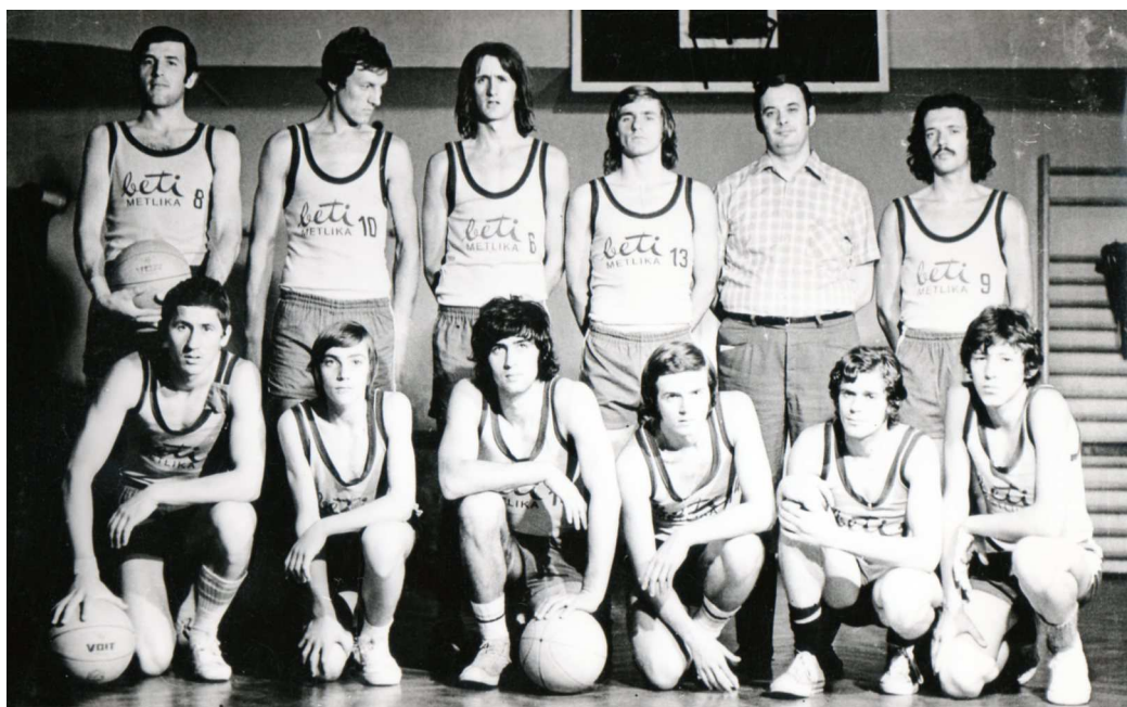
Slika 4: Ekipa iz leta 1972

Beti je leta 1972 še vedno nastopala v II. republiški ligi - center.