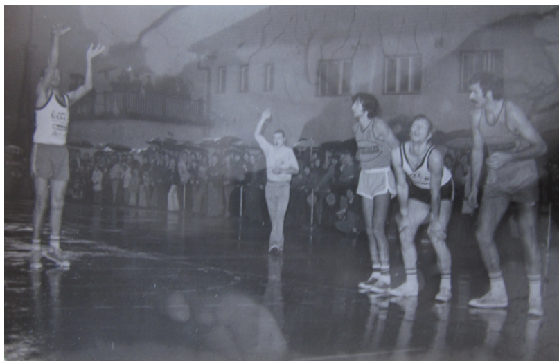
Slika 10: Tekma Beti - Olimpija. Finale pokala leta 1973