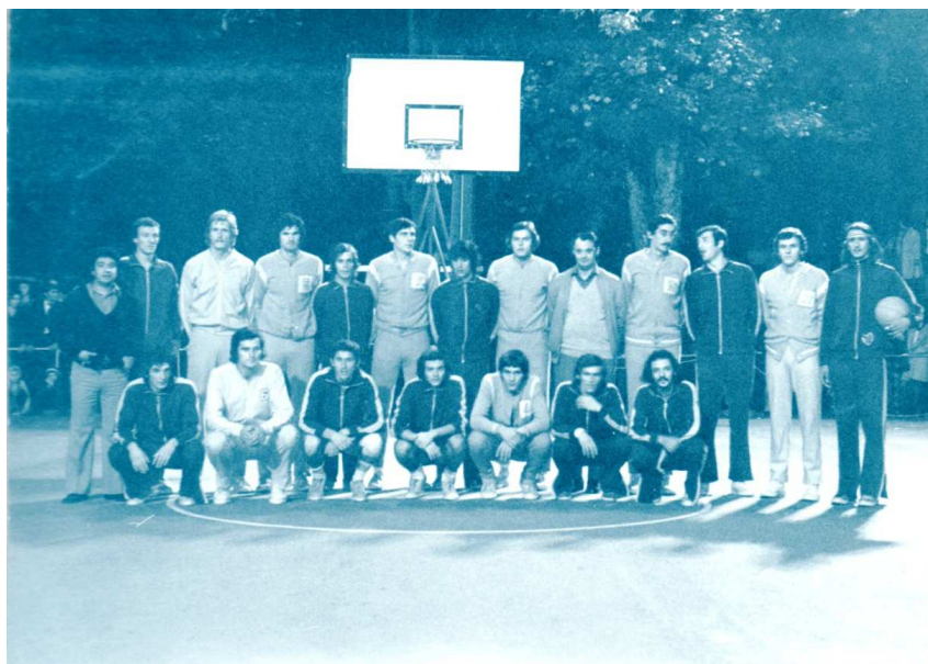
Slika 13: Finale pokala 1974