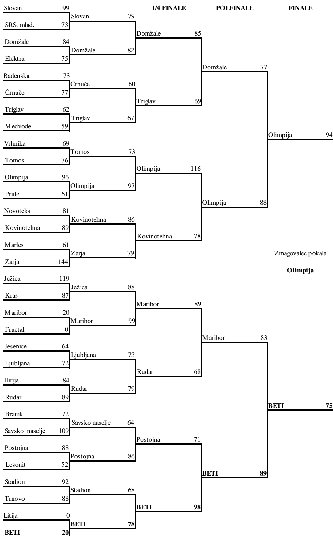
Slika 11: Rezultati pokalnega tekmovanja za leto 1973