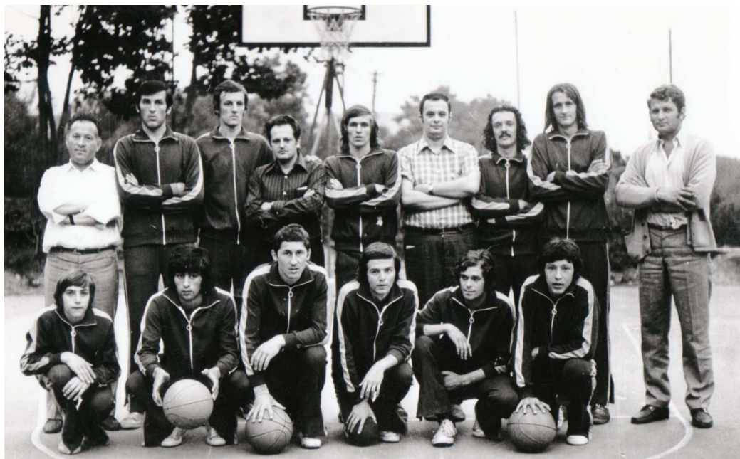
Slika 12: Ekipo Beti iz leta 1973

Stojijo z leve: Došen, Ž. Vergot, Lalić, Mrvar, Medek, trener Pšeničnik, Prevalšek, Dautović, Štrucelj