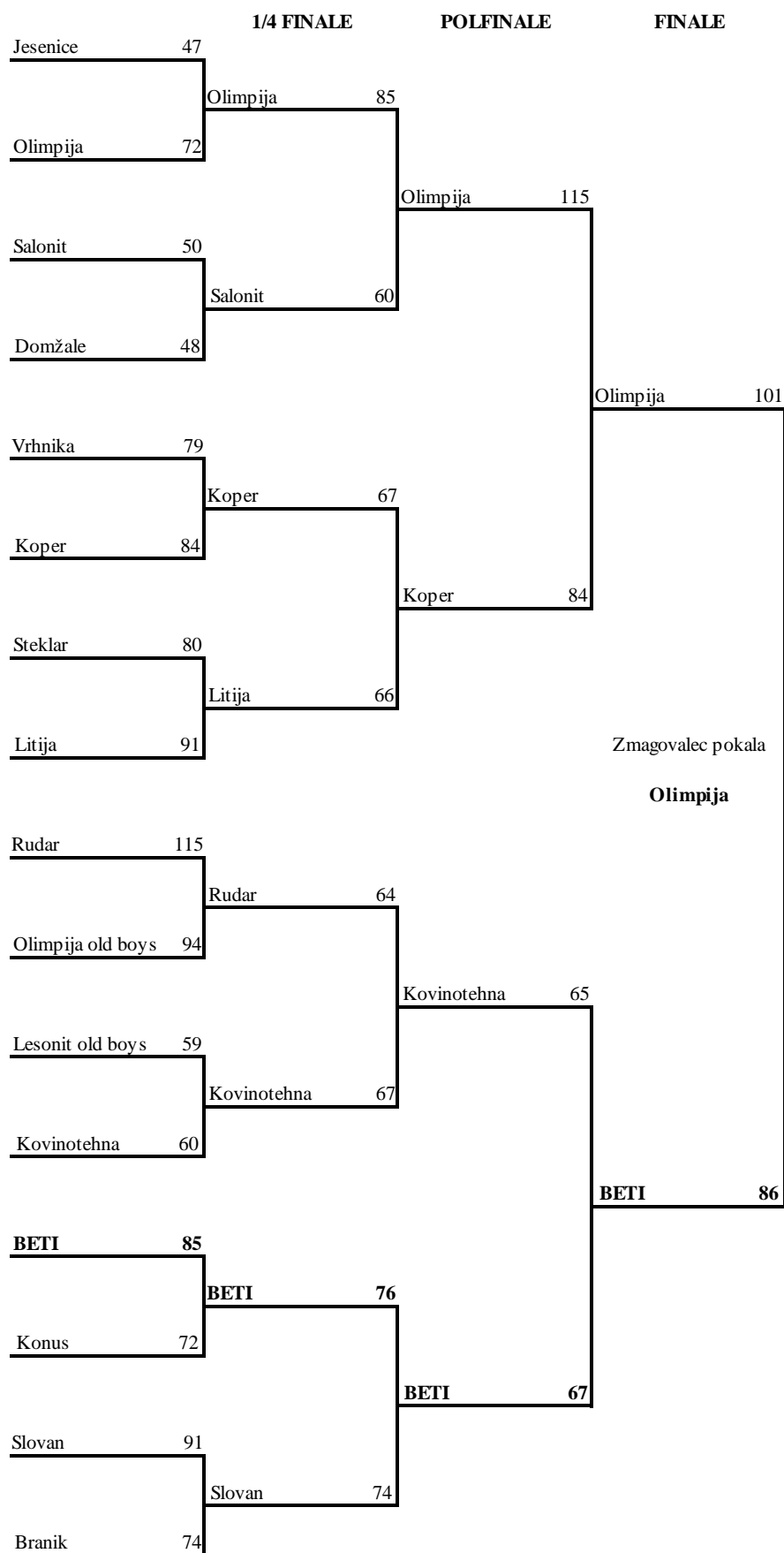
Slika 14: Rezultati pokalnega tekmovanja leta 1974