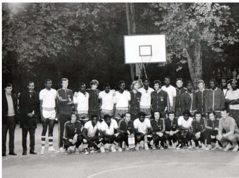
Slika 6: Igralci Beti in reprezentance Nigerije

Igralci Beti so leta 1972 odigrali več prijateljskih tekem z Novoteksom, Trnovim, Karlovcem 67 in Železničarjem iz Karlovca. Največ pozornosti je vzbudila tekma z reprezentanco Nigerije, ki si je s težavo priborila zmago.