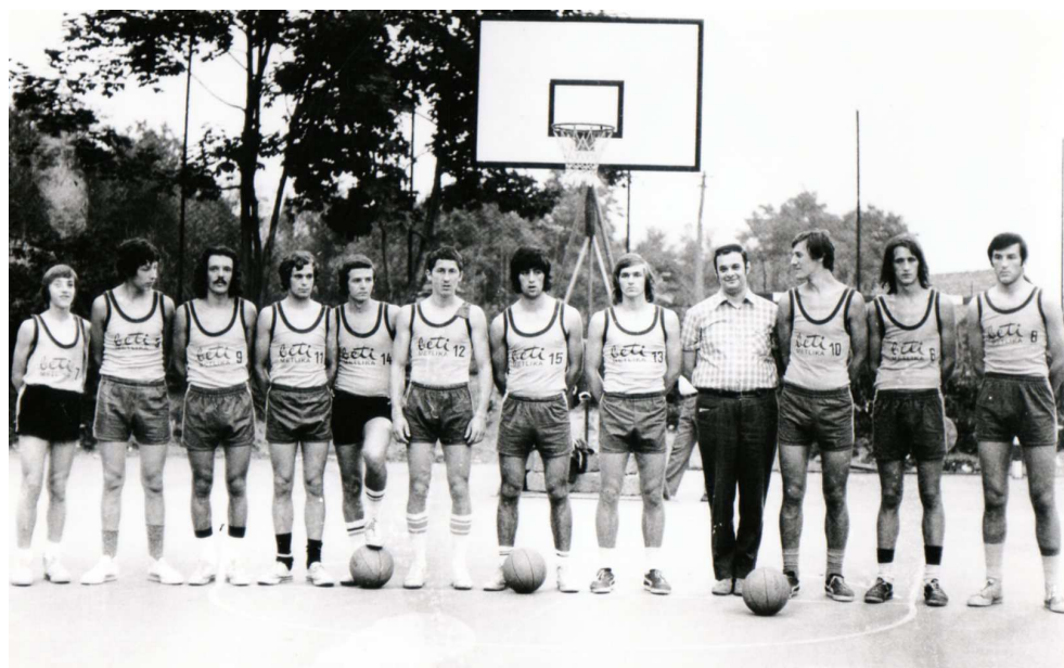
Slika 9: Ekipa iz leta 1973

Leta 1973 so igralci Beti sodelovali tudi v pokalnem tekmovanju in dosegli odličen rezultat. Uvrstili so se v finale slovenskega pokala in tako prišli med šestnajst najboljših ekip v Jugoslaviji.