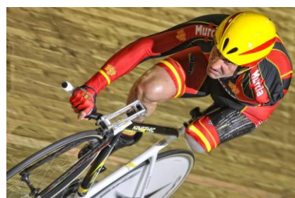
Slika 1. Paraolimpijski športi in logotip MPOK ( http://www.paralympic.org/photogallery , 2012).