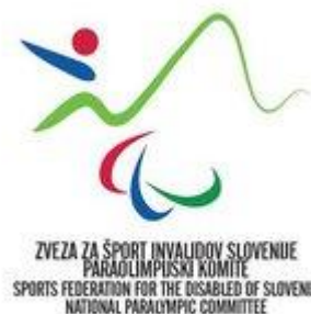
Slika 4. Logotip Zveze za šport invalidov – POK ( http://www.zsis.si/ , 2011).

V Sloveniji za šport invalidov skrbi krovna organizacija, ZVEZA ZA ŠPORT INVALIDOV (ZŠIS) , ki ima status nacionalne invalidske organizacije ter status reprezentativne nacionalne invalidske organizacije za področje tekmovalnega športa, športne organizacije invalidov in je ena od članic Olimpijskega komiteja Slovenije.