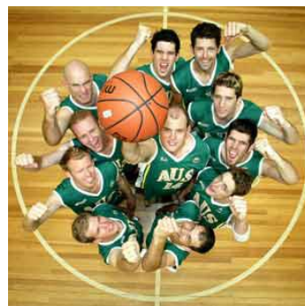
Slika 2. logotip Iger gluhih in naglušnih in košarkarske reprezentance Avstralije gluhih ( http://www.deaflympics.com/ , 2012).

Leta 1924 so v Franciji, v Parizu, organizirali »The Silent Games« (tihe igre), ki so bile prve organizirane mednarodne igre za osebe s posebnimi potrebami. Potekajo vsaka štiri leta, z