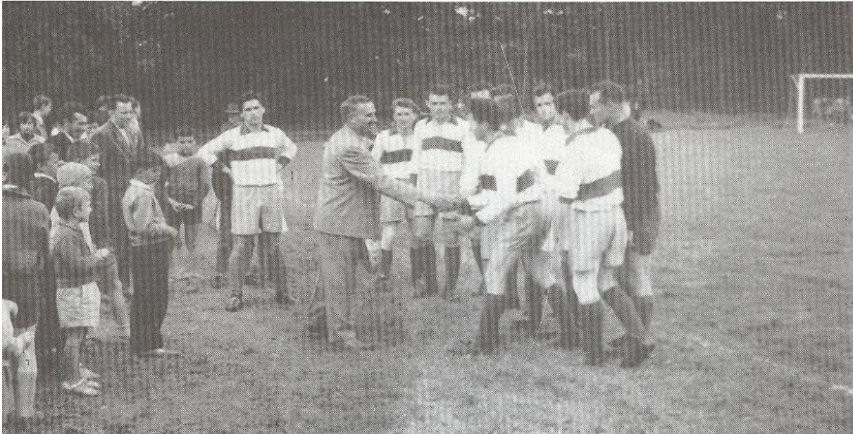
Slika 10: Ob otvoritvi prenovljenega nogometnega igrišča v beltinskem parku leta 1961. (povzeto po Maučec Feri, 45 let nogometa v Beltincih)