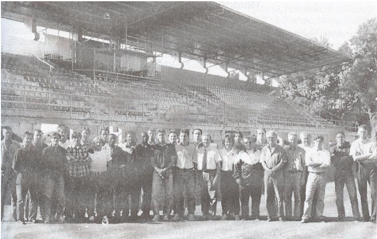
Slika 55: Nogometaši in funkcionarji Potrošnika leta 1998. (povzeto po Mauček Feri, 50 let nogometa v Beltincih)