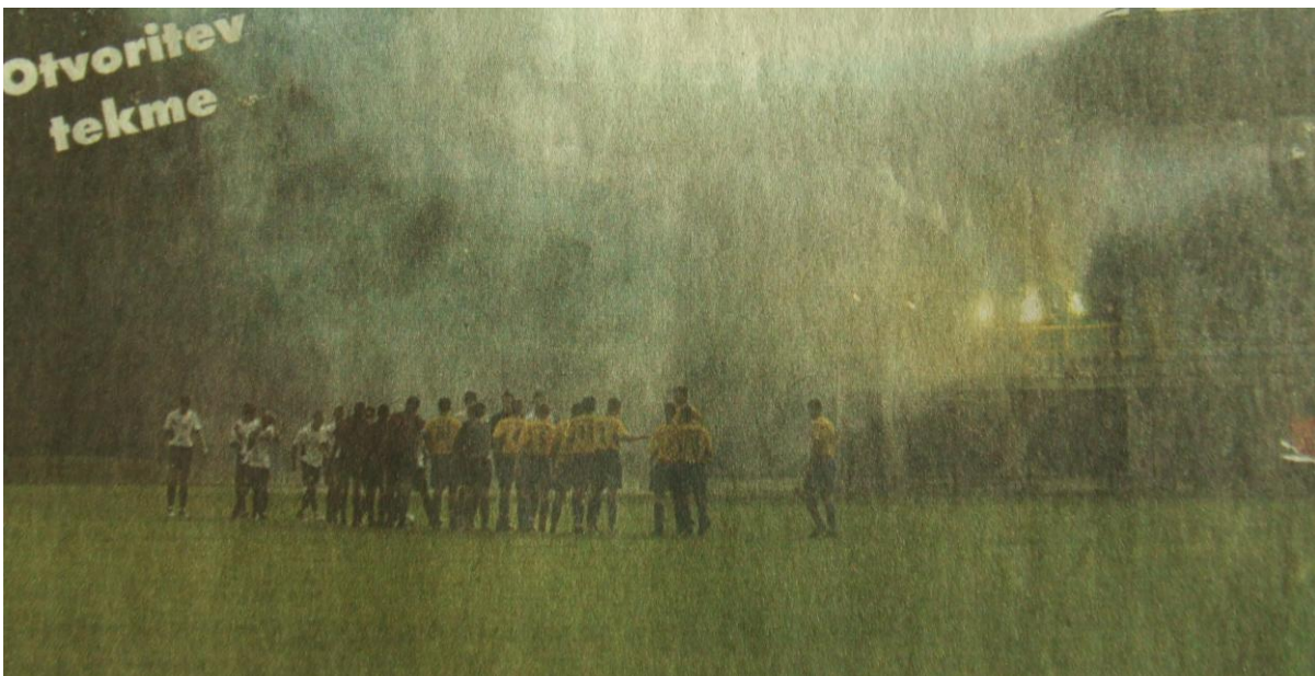
Slika 67: Navijači obeh ekip so na tekmi med Beltinci in Muro pripravili pravi spektakel. (povzeto po Pomurski Vestnik, 25.08.2005)