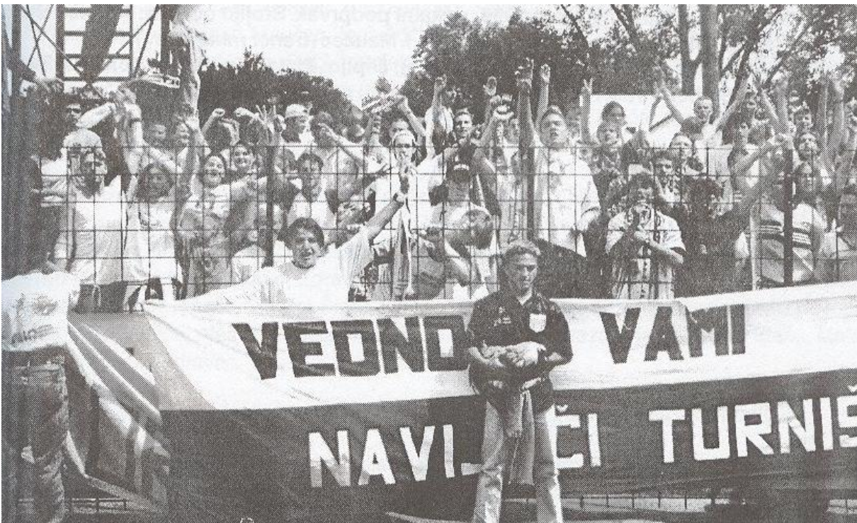
Slika 58: navijači Potrošnika. (povzeto po Maučec Feri, 50 let nogometa v Beltincih)