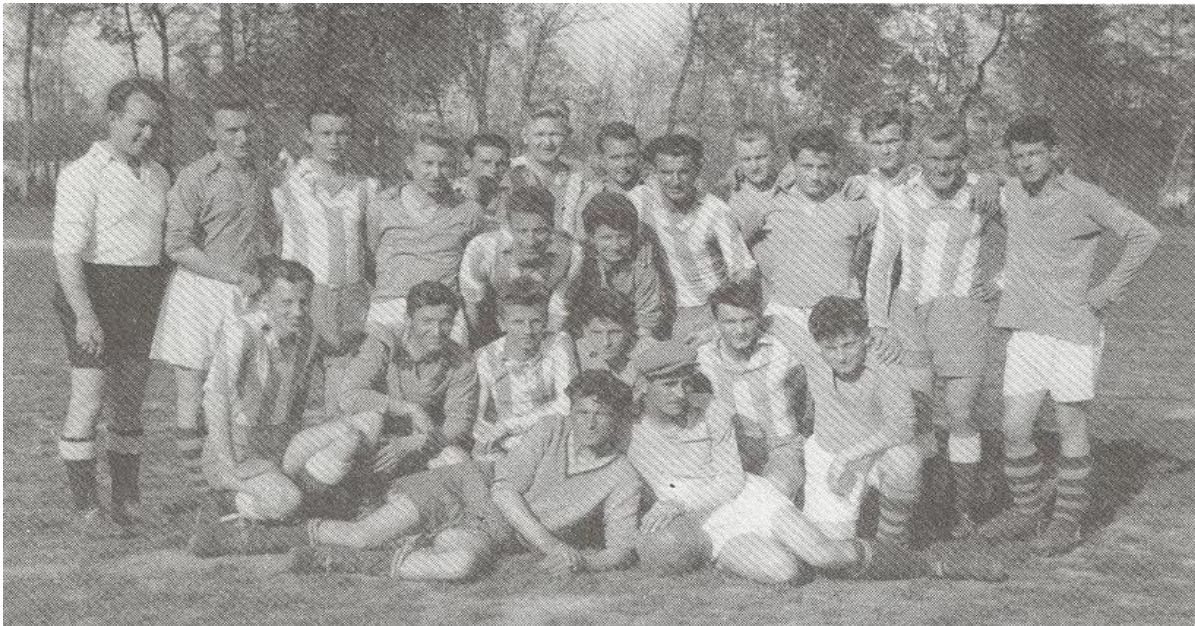
Slika 4: Prijateljska tekma Beltinci proti Mura II.