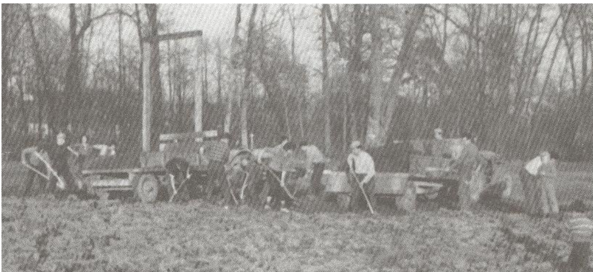
Slika 9: Urejanje igrišča leta 1961. (povzeto po Maučec Feri, 45 let nogometa v Beltincih)

V beltinskem parku so leta 1961 začeli urejati nogometno igrišče, ki je bilo v slabem stanju. V ta namen je bila ustanovljena MDB, ki je delala tri tedne vsako popoldne. Državno posestvo Beltinci pa je zoralo in zravnilo igrišče. Na preurejenem igrišču so Beltinci odigrali prvo tekmo s Tišino in zmagali s 4:1. (Maučec, 1994)