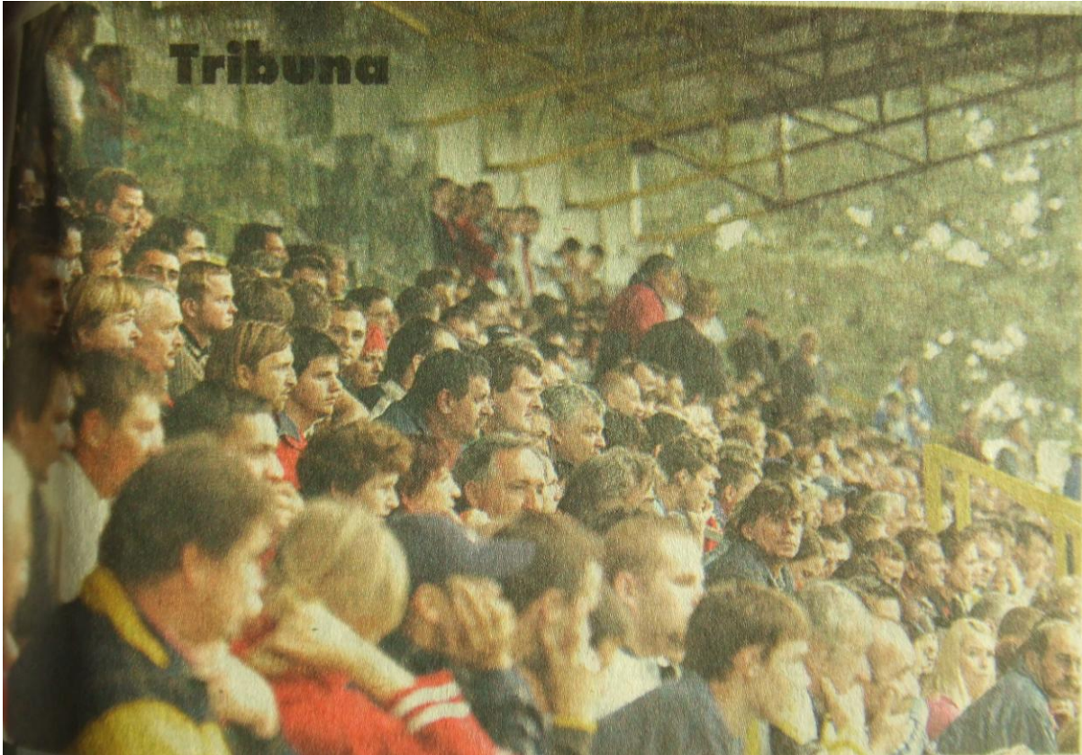
Slika 66: Tekmo med Beltinci in Muro si je vedno ogledalo veliko gledalcev. (povzeto po Pomurski Vestnik, 25.08.2005)