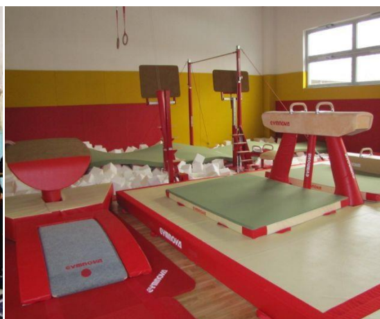
Slika 33. In pogoji danes.

V življenju sicer ni imel veliko časa za druge hobije, saj je poleg gimnastike skrbel še za svoje tri otroke, ki so prav tako posredno ali neposredno povezani s športom.