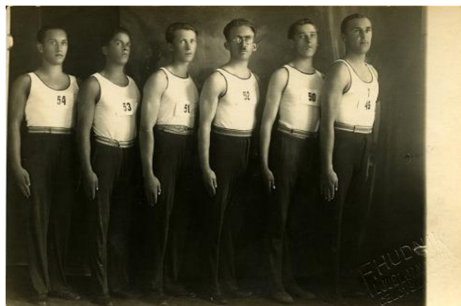
Slika 21. Stari brežiški Sokoli ("100-letnica TD Sokol", 2004).

Po prvi svetovni vojni so se vrste Brežiškega Sokola še povečale, saj je število zrastle iz 218 na 320 članov. Ob proslavi 30. letnice društva je bil organiziran velik nastop na stadionu v Brežicah. Kljub velikim političnim silam je bil Brežiški Sokol vodilna sila, ki ni klonila, obdržal se je do kapitulacije leta 1941. ("100-letnica TD Sokol Brežice", 2004)