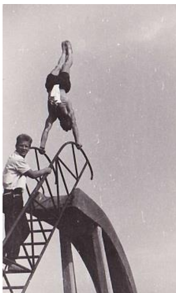
Slika 12. Stoja na vrhu tobogana.