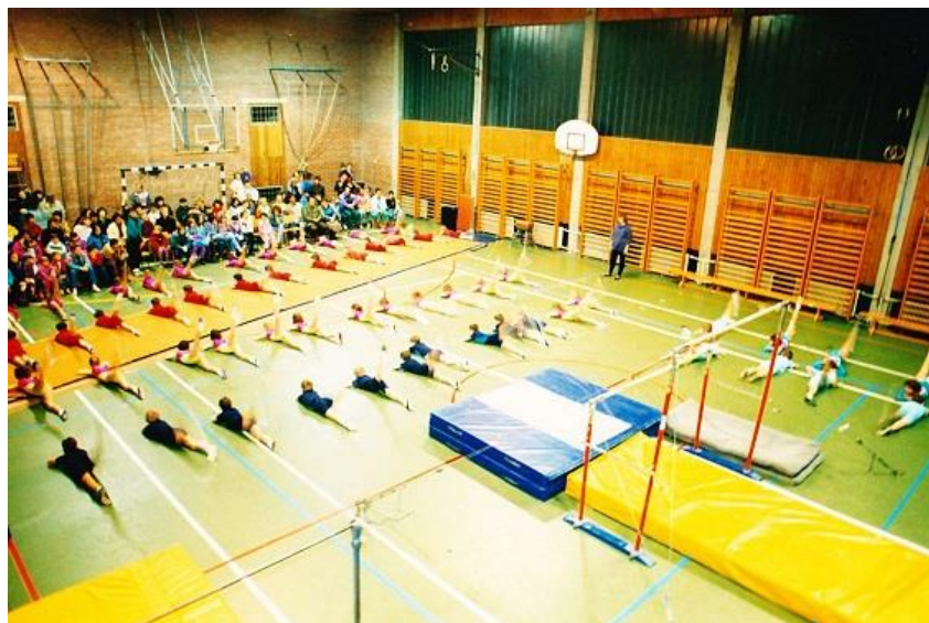
Slika 26. Nastop športnih oddelkov.

prevečkrat sprevrže v divjanje. A tako žal ne gre – pri gimnastiki je potreben dril, dril in še enkrat dril.« (J. Senica, osebna komunikacija, julij 2013)