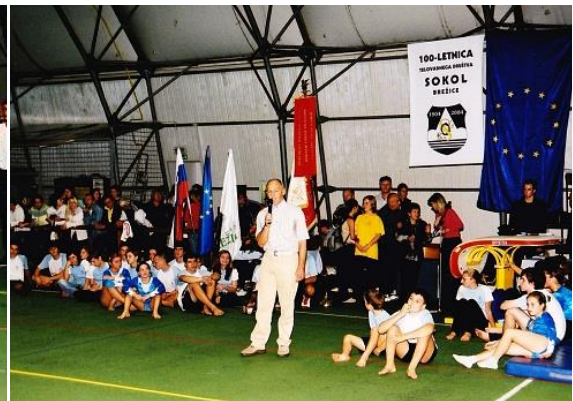
Slika 30. S svojim prihodom nas je počastil in pozdravil Miroslav Cerar.

Z letom 2005 se je začelo sodelovanje z gimnastično šolo Ollerup na Danskem. Najprej smo mi odpotovali na sever, kjer smo nastopali na največjem športnem festivalu, pred očmi danskega kralja in kraljice. Bilo je več kot 40.000 udeležencev. Leto kasneje so nam telovadci iz Ollerupa vrnil obisk, kjer smo skupaj nastopili v Piranu, Ljubljani, Sevnici in na festivalu Lent v Mariboru. Sodelovanje je preraslo v pravo prijateljstvo, iz našega kluba pa so na šolanje na Dansko odšli trije trenerji.