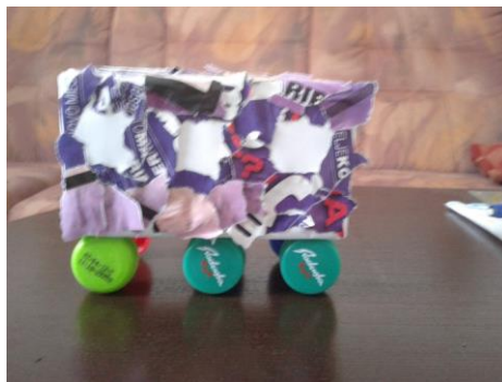
Slika 3. Naš končni izdelek avtobusa.

V igralnici sledi likovno ustvarjalna delavnica. Otroci s seboj v vrtec prinesejo prazne škatle oz. škatlice - čajev, zdravil, čevljev ter pokrovčke plastenk. S pomočjo teh pripomočkov otroci s pomočjo domišljije ustvarjajo prometna prevozna sredstva. Ko je prevozno sredstvo dokončano, ga s tempera barvami pobarvamo oz. izdelujemo še lepenko: na tovornjak nalepimo majhne listke, ki jih odtrgamo iz starega časopisa, revij ali iz kolaž papirja. Ko je vozilo pobarvano oz. polepljeno, nanj nalepimo leseno palčko in dobimo vozilo, ki ga lahko premikamo.