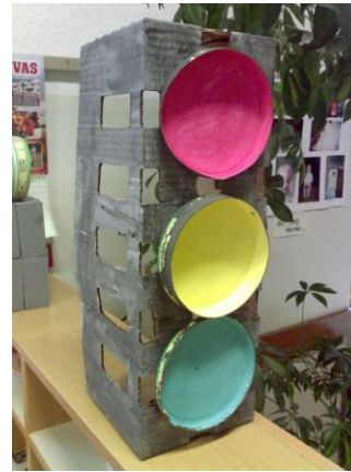
Slika 6. Končni izdelek semaforja.

Izdelamo lahko tudi semafor. Za izdelavo semaforja potrebujemo malo večjo škatlo, ki jo oblečemo v bel list papirja. Nanj nalepimo različno pobarvane kroge. Kroge in bel papir samo še pobarvamo in dobimo semafor.