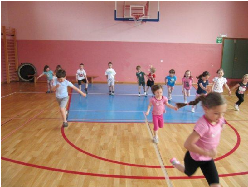
Slika 2. Igranje gibalnih igrvic v telovadnici.

Igro lahko modificiramo s spremembo načina gibanja: sprva otroci tečejo naprej, nato nazaj, lahko oponašamo gibanje kužkov, pajkov, tečemo po prstih kot miške, po petah, delamo zajčje poskoke.