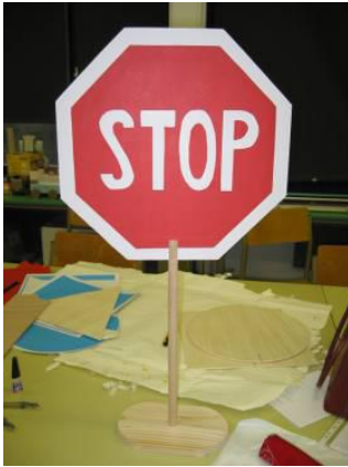
Slika 5. Končni izdelek prometnega znaka.

Ko otroci zrežejo in uredijo izrezane šablone, jih nalepimo na trši papir - karton, ter jim dodamo palico, po možnosti s stojalom, katere priskrbimo vzgojitelji/učitelji. Kartone otroci nalepijo na palico s stojalom in tako dobimo prometni znak. Končni izdelki so takšni: