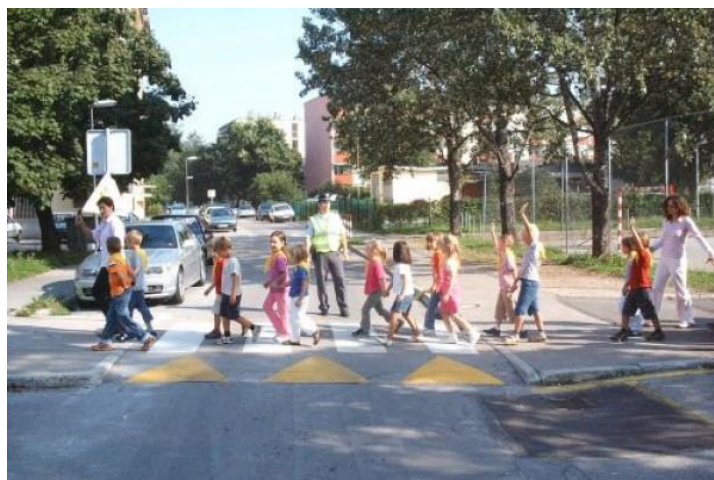
Slika 1. Varno prečkanje ceste.

Po sprehodu utrinke narišemo na list papirja.