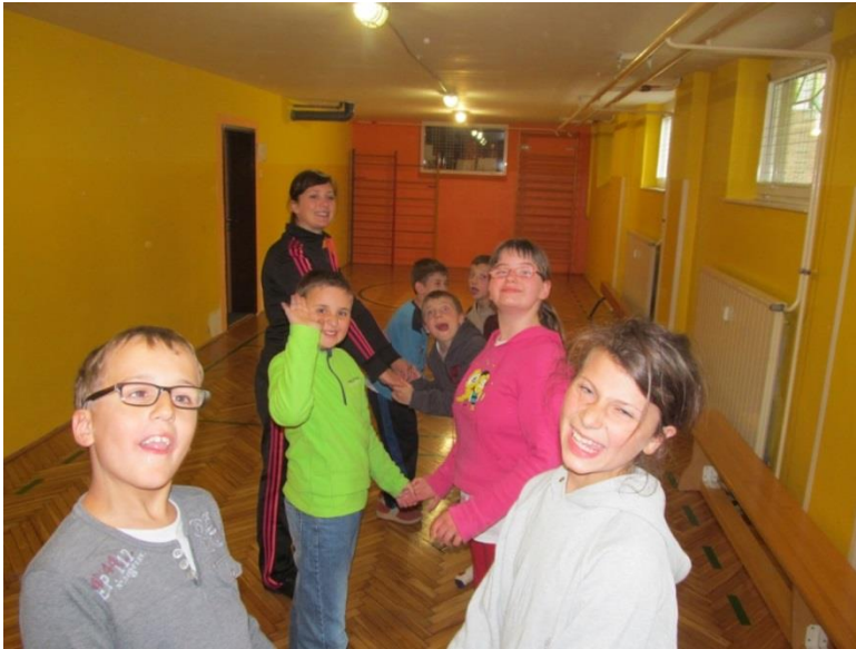
Slika 1. Otroci s posebnimi potrebami, OŠ Juričevega Drejčka Ravne na Koroškem.

prostovoljci. S sistematičnim, načrtnim in trdim delom je mogoče doseči napredek na področju športa in ljudi s posebnimi potrebami (Vute, 1999).