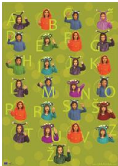
Slika 3. Enoročna abeceda TAKA TUKA. Zveza društev gluhih in naglušnih Slovenije, (2014). Pridobljeno iz http://www.zveza-gns.si/?attachment_id=20577

Gluhota: Otrok z najtežjo izgubo sluha ni sposoben slišati in razumeti govora, tudi če je ojačan. Otrok ne more v celoti sprejemati govora niti s pomočjo slušnega aparata. Pri njem so prisotne prizadetost sporazumevanja, razumevanja in poslušanja govora ter druge vrste prizadetosti poslušanja. Pogosta je sočasna prizadetost vedenja, orientacije v času in prostoru, prilagajanja vedenja okoliščinam in prizadetost pri pridobivanju znanja. Otrok je oviran v orientaciji, telesni neodvisnosti in vključevanju v družbo (Hernja idr., 2010).