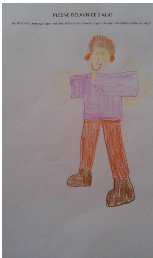
Slika 13. Risba učenke s posebnimi potrebami (osebni arhiv).

Slika 13 prikazuje oris plesne delavnice skozi oči učenke 4. razreda OŠ Juričevega Drejčka Ravne na Koroškem.