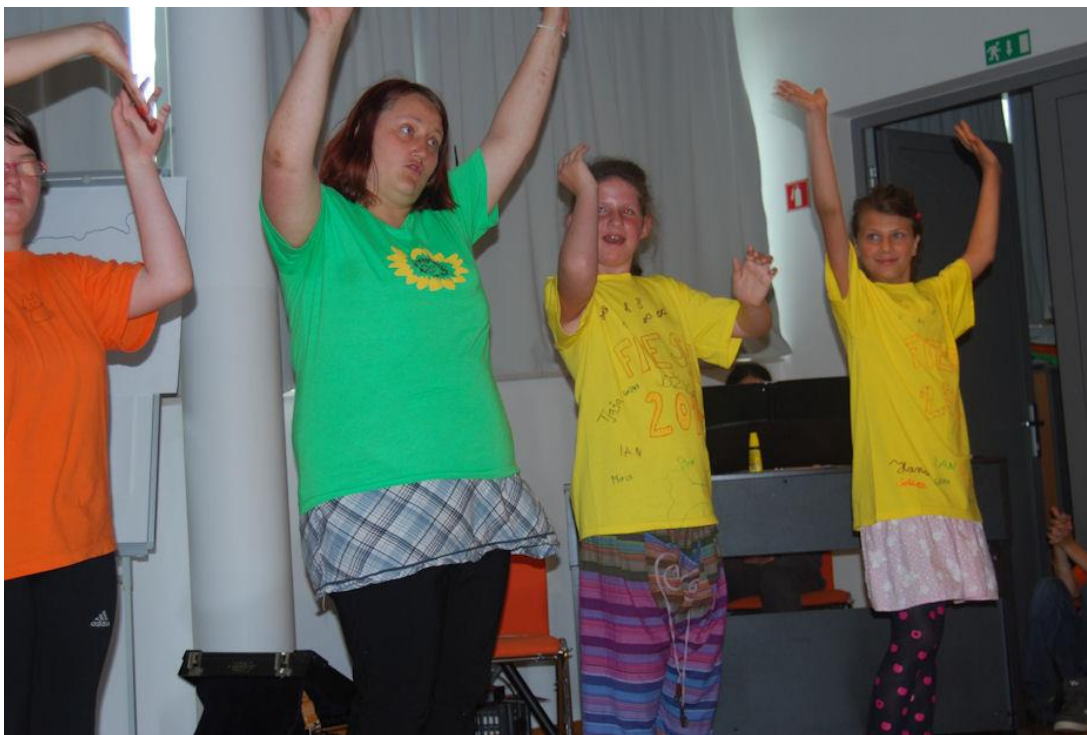
Slika 10. Nastop učencev OŠ Juričevega Drejčka v Kulturnem domu Ravne na Koroškem (osebni arhiv).

24. junija 2014 je bila v Kulturnem domu Ravne na Koroškem organizirana zaključna prireditev, kjer so učenci OŠ Juričevega Drejčka nastopali dve plesni koreografiji, v okviru plesnih dejavnosti, ki smo jih izvajali na šoli od aprila do junija. Mlajša skupina je zaplesala »Mi gremo pa na morje«, starejša skupina pa koreografijo »Pleš«, izvajalca Trkaja.