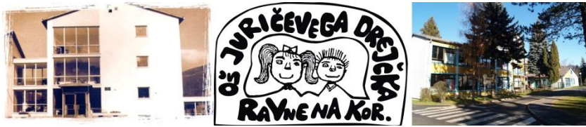
Slika 9. Logotip in Osnovna šola Juričevega Drejčka Ravne na Koroškem (2014). Pridobljeno iz http://osjd.mojasola.si/default.aspx