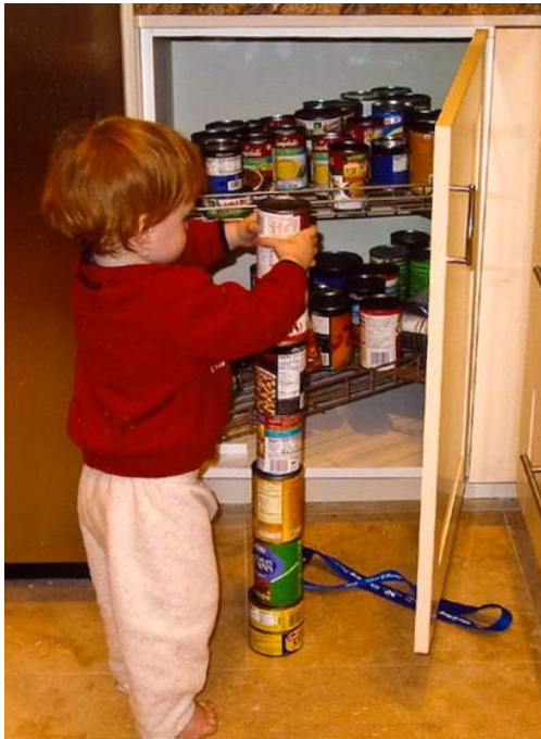
Slika 5. Otrok z avtistično motnjo (2014).

Potrebno je razumeti, da je avtizem širok spekter motenj, ki niha od lažjih do težjih motenj znotraj same motnje (Avtizem, 2014).