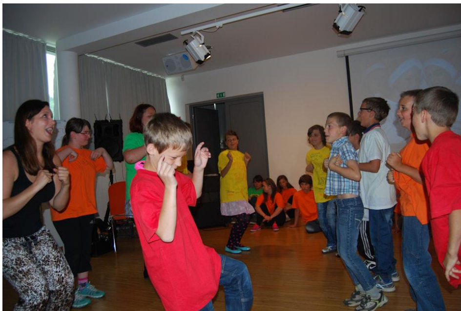
Slika 12. Nastop v Kulturnem domu Ravne na Koroškem. OŠ Juričevega Drejčka (2014).

koreografijo, ki je primerna za vse, kar uporabimo za nastope pred starši ali za različne delavnice, ko združujemo skupine.