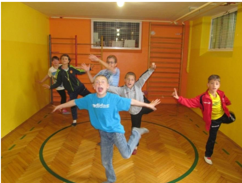
Slika 6. Otroci Osnovne šole Juričevega Drejčka.

Na sliki 6 je prikazan del gibalne improvizacije otrok s posebnimi potrebami, ki smo ga uporabljali za uvodno ogrevanje (ogrevalna igrica Kipi).