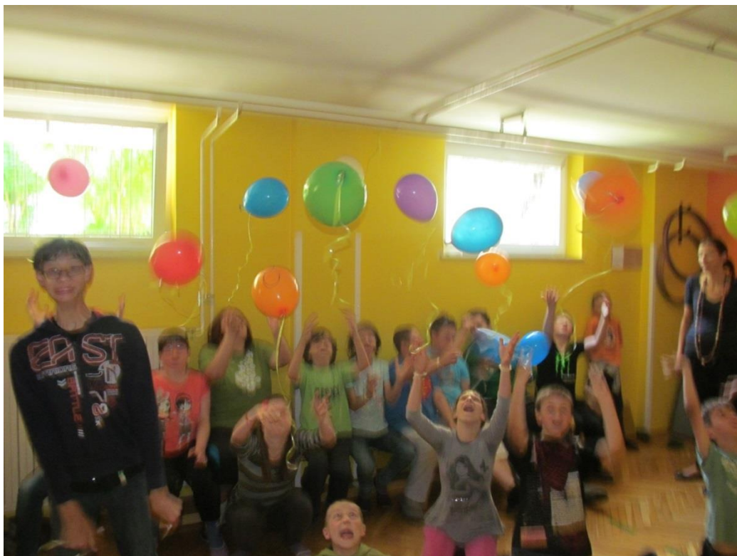
Slika 8. Zaključek plesnih dejavnosti na OŠ Juričevega Drežčka.

Metoda plesno-gibalne terapije oziroma plesnih dejavnosti nasploh je dobrodošla za delo z različnimi tipi otrok s posebnimi potrebami. Z različnimi plesnimi gibanji otroci sproščajo napetost in spoznavajo svoje telo, um in notranji jaz, vse skupaj pa vodi k razvijanju pozitivne samopodobe, kar je pri teh otrocih eden izmed največjih problemov (Geršak, Sedevčič in Erban, 2005).