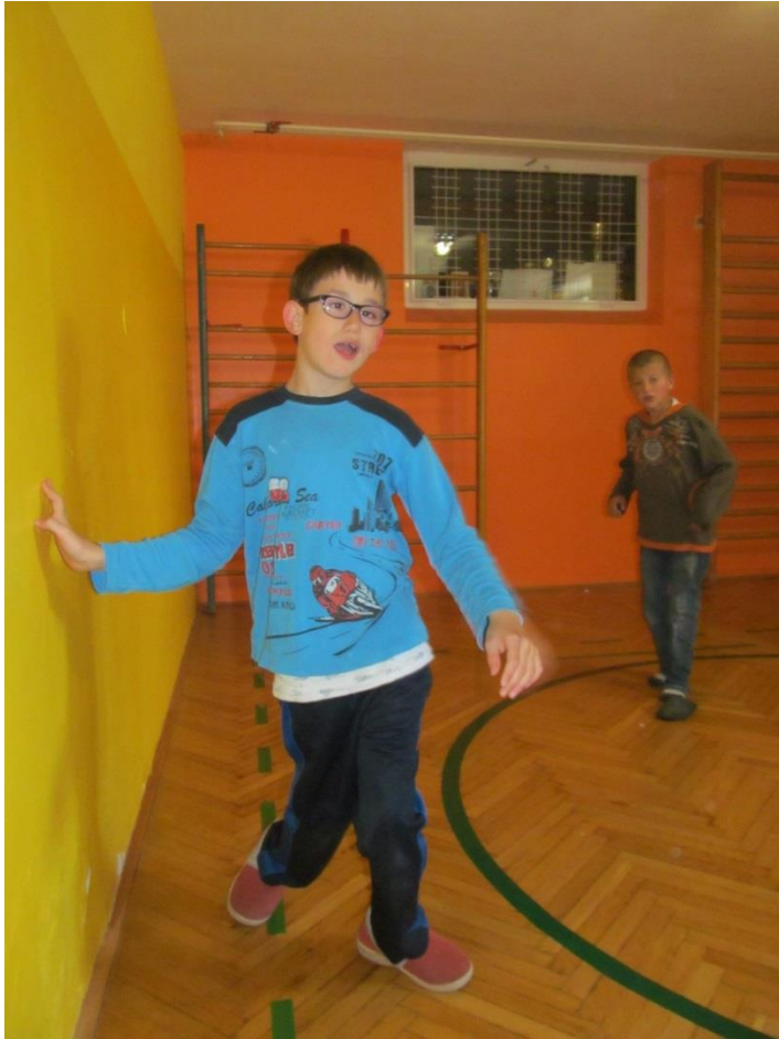
Slika 4. Otrok s cerebralno paralizo.

Na sliki 4 je otrok s cerebralno paralizo in obiskuje OŠ Juričevega Drejčka. Vključen je bil v program plesnih dejavnosti in se nam z veseljem pridružil pri določenih plesih. Ves čas je imel spremstvo učitelja.