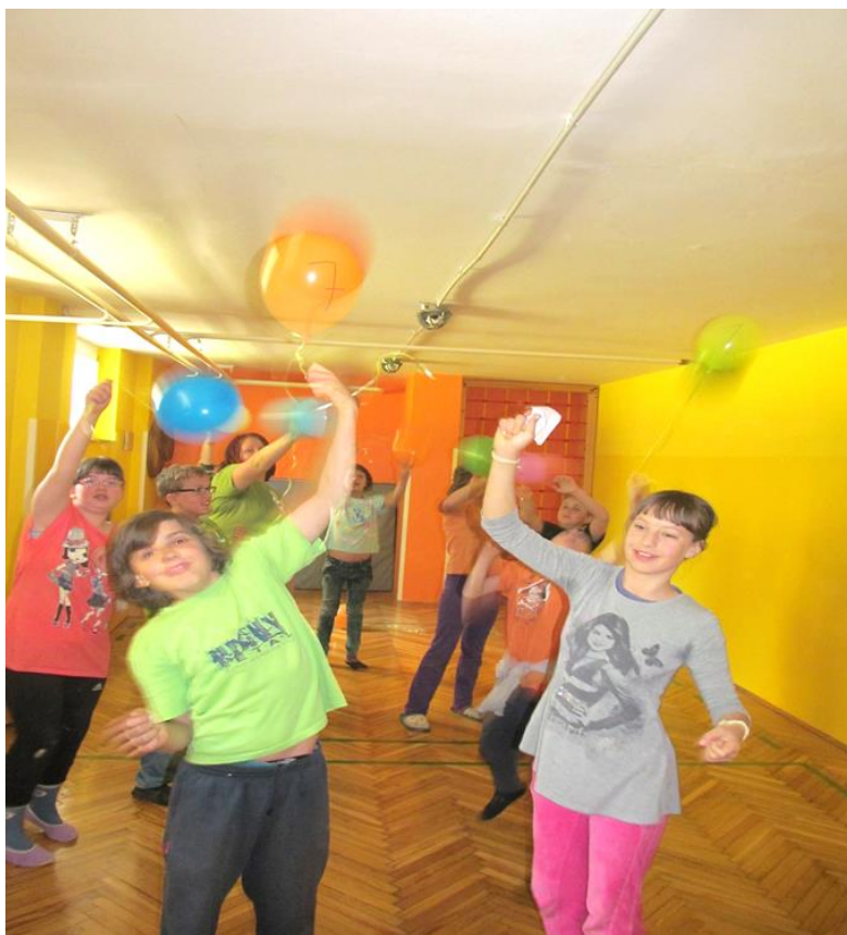
Slika 11. Ogrevalna igrica Baloni s številkami.

Slika 11 prikazuje otroke OŠ Juričevega Drejčka na zaključni uri plesnih dejavnosti, ko smo izvajali ogrevalno igrico z baloni.