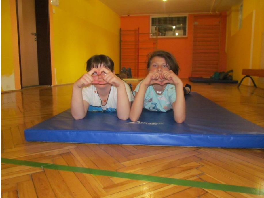
Slika 7. Sproščanje na plesnih delavnicah OŠ Juričevega Drejčka Ravne na Koroškem (osebni arhiv).

uporabljene energije in ob lastnih vzorcih gibanja. Prav plesno gibalna terapija temelji na celovitem pristopu, ki pojmuje človekovo percepcijo, procesiranje in reagiranje kot neločljivo povezanost telesa in duha v funkcionalno celoto (Kroflič, 1999).