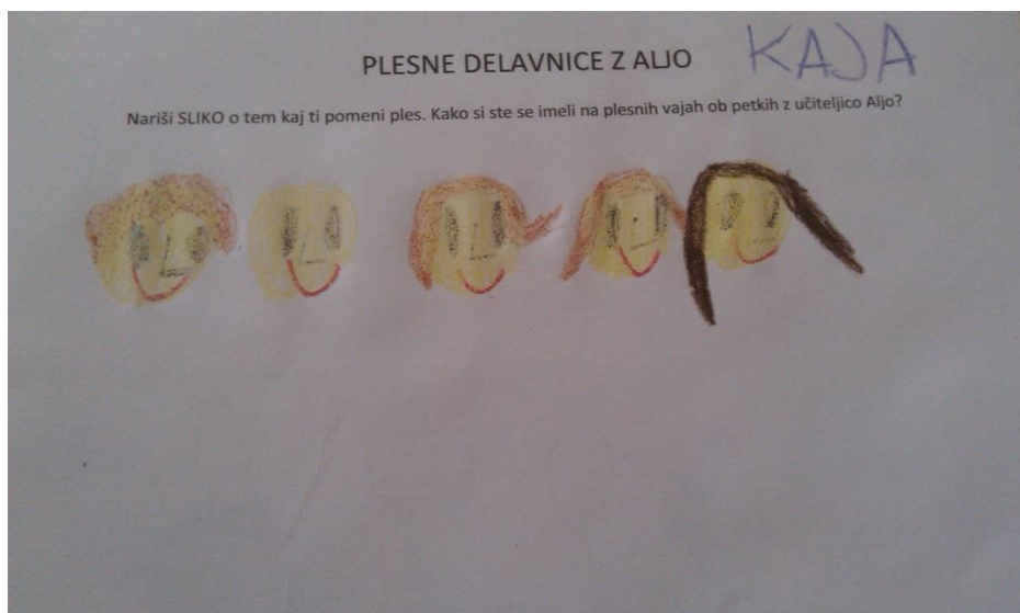
Slika 14. Risba učenke s posebnimi potrebami (osebni arhiv).

Slika 14 prikazuje oris plesne delavnice skozi oči učenke 5. razreda OŠ Juričevega Drejčka Ravne na Koroškem.