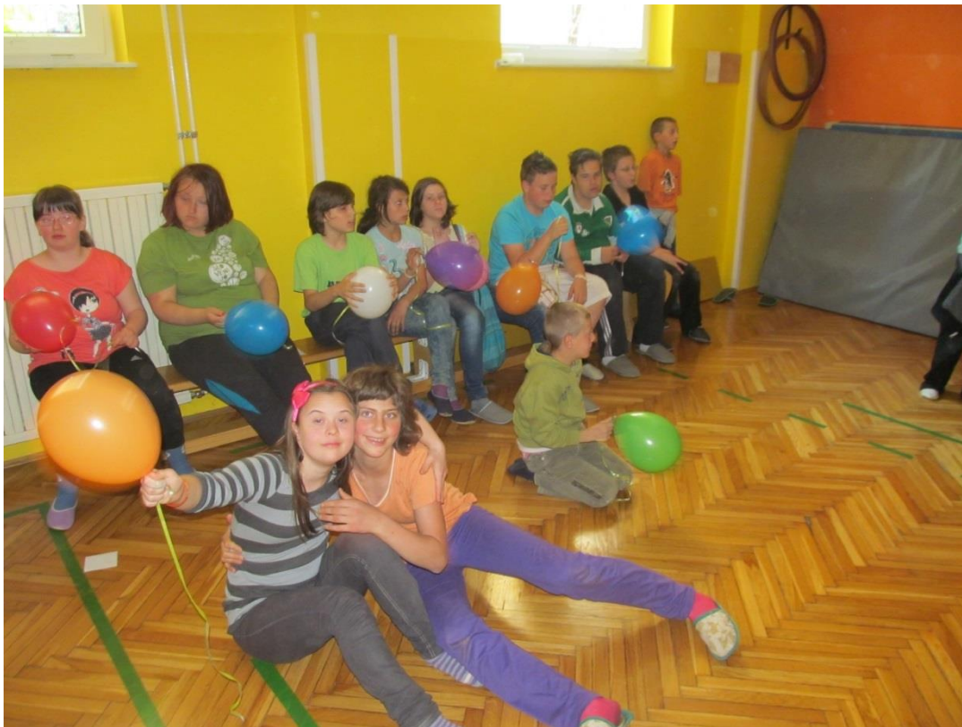
Slika 2. Učenka z Downovim sindromom.

Pri otrocih z Downovim sindromom zasledimo IQ od 20 do preko 100, rodijo pa se z zelo različnimi sposobnostmi. Skoraj vsi otroci z omenjenim sindromom se razvijajo še v obdobju pozne adolescence in zgodnje odraslosti in se večino življenja učijo novih spretnosti in znanj. Razvoj je lahko včasih hiter, včasih počasen, če pa gledamo povprečne vrednosti, je njihov IQ približno enak od tretjega leta starosti do zgodnjega obdobja adolescence. Večina teh otrok bo spadala v kategorijo zmerne in lažje zaostalosti, če jim le omogočimo dobro zdravstveno oskrbo, zgodnje učenje in čustveno varnost. Lahko pa se zgodi, da bodo napredovali zelo počasi, celo do starosti poznih dvajsetih let ali še kasneje (Cunningham, 1999).