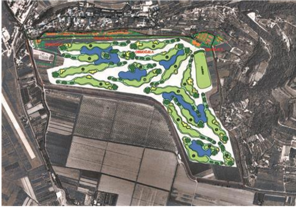
Slika 25. Načrt predvidenega igrišča za golf v Sečovljah (Hlaj, 2011).