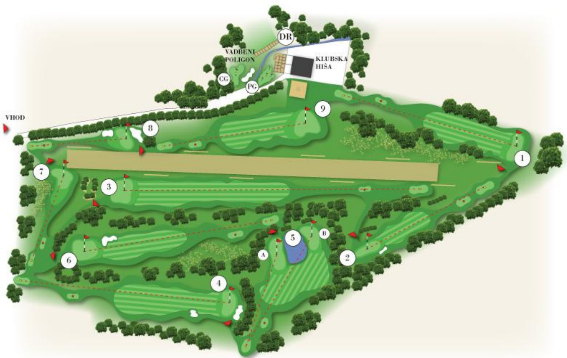
Slika 23. Načrt golf igrišča Radenci (»Igrišče za golf«, 2016).

Golf igrišče Radenci z devetimi igralnimi polji leži med polji z vreclci zdravilne vode, obdajajo pa ga kapelske gorice. Posebnost igrišča je polje številka pet, ki ima dve zelenici ločeni z vodno oviro, in pristajalna steza za ultralahka letala, ki se nahaja na sredini igrišča (»Igrišče za golf«, 2016). Ob igrišču stoji tudi golf hiša, kjer se nahaja osvetljeno vadišče, ki omogoča vadbo kratke igre ter bližanja na zelenici, vadbo udarcev iz peščene ovire in poligon za vadbo dolgih udarcev (»Vadišče«, 2015).