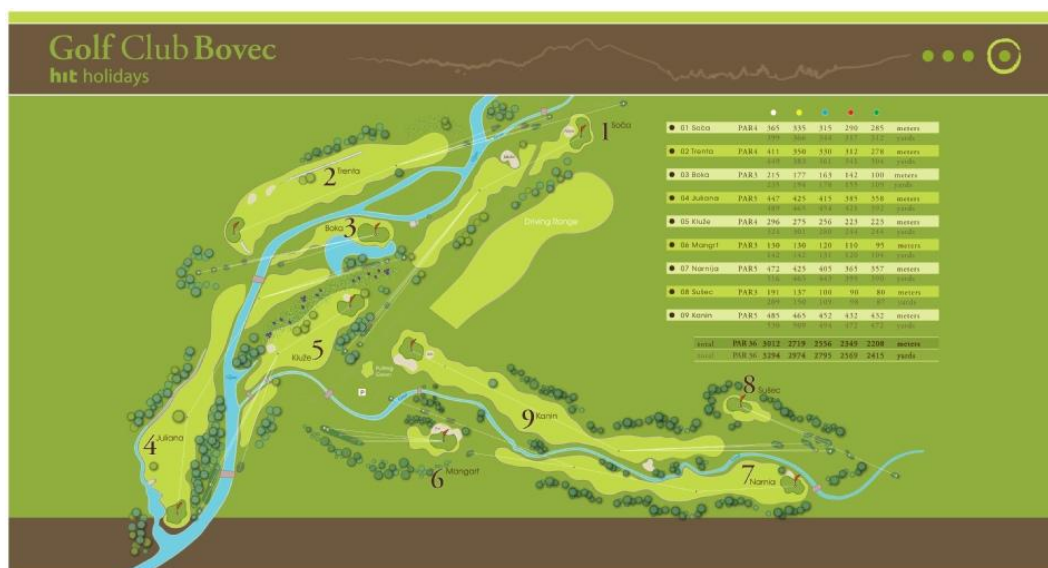
Slika 19. Razporeditev igralnih polj golf igrišča Bovec (»Hole«, 2016).

Da je igrišče v Bovcu, ki je zgrajeno v sožitju z naravo in jo obdajajo Julijske Alpe, nekaj posebnega, nam pove dejstvo, da so tukaj snemali Disneyjevo filmsko uspešnico Zgodbe iz Narnije (»Golfcard – Unlimited«, 2011).