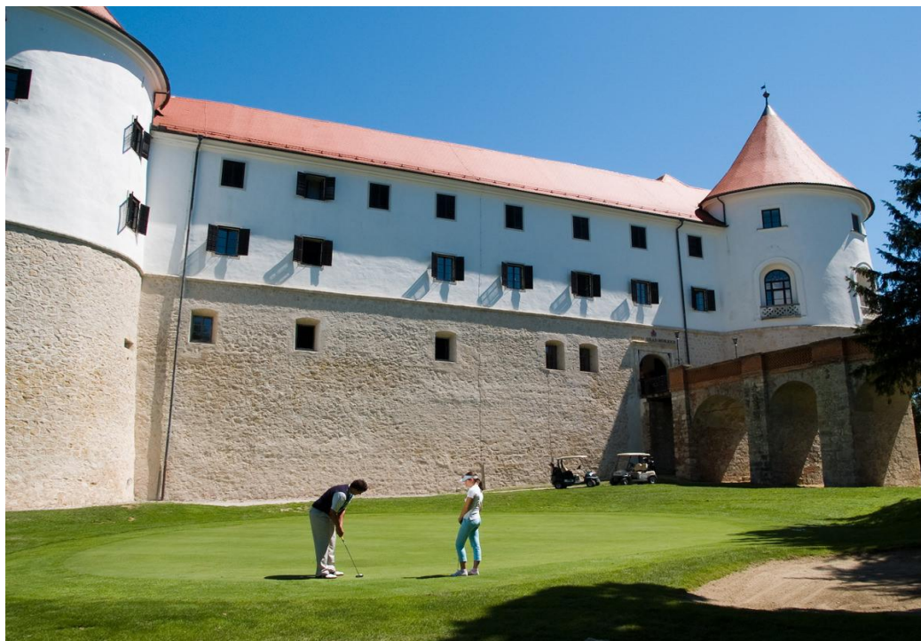
Slika 10. Golf igrišče Grad Mokrice (»Golf igrišče«, 2016).

igrišča za golf (v Ekar, 1996a). Tako je razvoj igrišča v Mokricah temeljil na predstavitvi na tujem trgu, od katerih je bila pomembna predvsem Hrvaška (Fevžer, 1995).