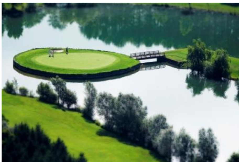
Slika 13. Znamenita 14. zelenica na sredini jezera (»Golf igrišče Ptuj«, 2016).