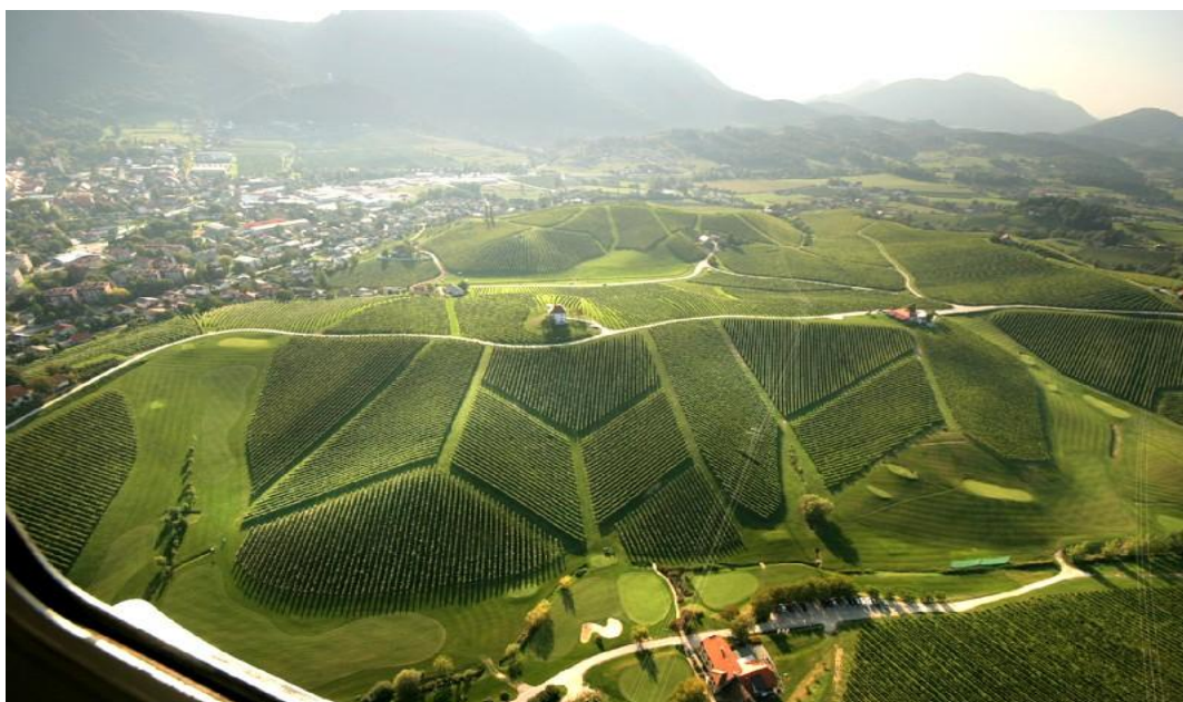
Slika 15. Golf igrišče Zlati Grič (»Golf igrišče«, 2016).

Kljub naraščanju števila članov kluba, Janez Lešnik, menedžer igrišča za golf Zlati Grič, pravi, da si bolj kot številčno močan klub v Slovenskih Konjicah želijo aktivne člane, ki bi predvsem z družabnostjo prispevali k pravemu klubskemu življenju (v Senčar, 2002c).