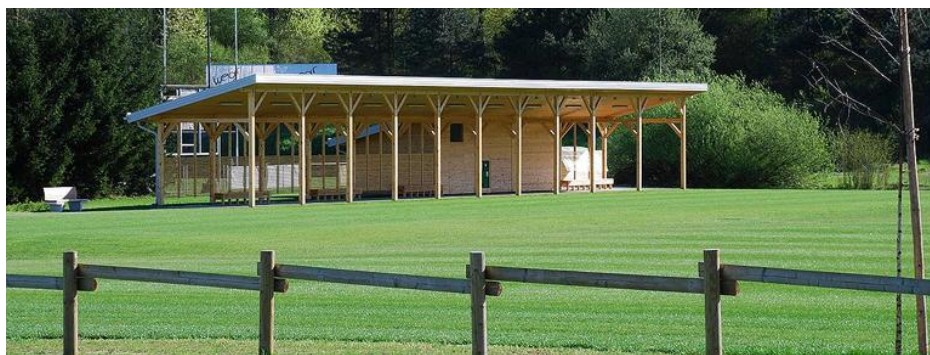
Slika 22. Pokrito vadbišče golf centra v Stanežičah (»Ljubljana dobila novo«, 2016).

Septembra 2014 so igrišče, ki je bilo financirano s strani Mestne občine Ljubljana, Fundacije za šport RS in Javnega zavoda Šport Ljubljana, tudi uradno odprli. Golfsko igrišče v Stanežičah, ki ima devet kratkih igralnih polj in dve vadbeni zelenici, je v prvi vrsti namenjeno mladim igralcem golfa in šoli golfa za ljubljanske klube ter društva (Remih, 2015).