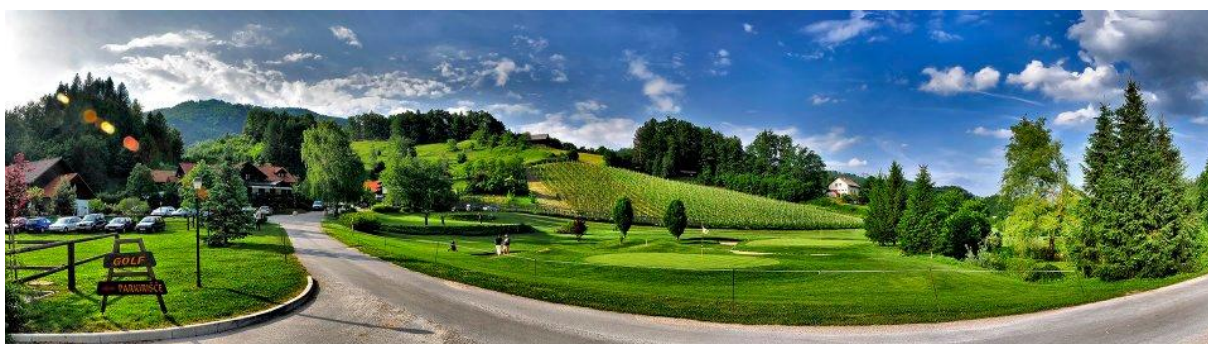
Slika 16. Golf igrišče "A" Olimje (»Amon Olimje«, 2016).

Maja 2001 so uradno odprli igrišče za golf z devetimi igralnimi polji, ki je bilo zgrajeno že v prejšnjem letu, ampak so zaradi suše, ki je kljub računalniško vodenemu namakalnemu sistemu uničila zelenice, morali odprtje preložiti. Pobudniki izgradnje igrišča so bili v letu 1999 navdušenci za golf iz domačiji Amon, ki so s svojimi načrti prepričali tudi občino, katera je nudila pomoč pri reševanju lastniških vprašanj ter pri postopkih pridobivanja prostorske dokumentacije (Grušovnik, 2001).