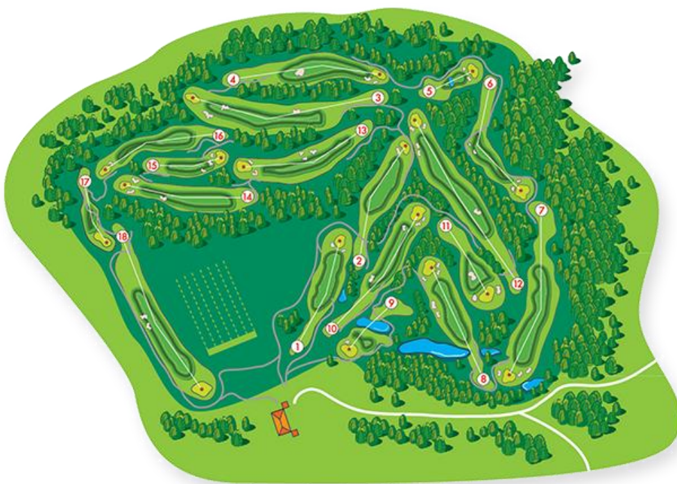
Slika 18. Načrt igrišča Golf Grad Otočec («Igrišče», 2016).

Takoj po izgradnji prvih devet lukenj se je začela gradnja preostalih devet, ki je bila leta 2009 tudi zaključena in tako so golf igrišče z 18 luknjami na Otočcu 19. junija istega leta tudi uradno odprli. Celotna investicija je bila vredna dva milijona evrov, od tega so v Termah Krka 500.000 evrov pridobili iz Evropskega sklada za regionalni razvoj («Dva milijona evrov», 2009). Igrišče z 18 luknjami, parom igrišča 72 ter skupni dolžini 6189 metrov, ki stoji na 75 hektarov površine, ima 49 peščenih ter 3 vodne ovire. Tako je nastalo eno izmed daljših slovenskih igrišč, kjer ima vsako igralno polje pet odbijališč, na čistinah je veliko vzpetin in dolin ter velike in dokaj nezahtevne zelenice. Poleg igrišča so uredili še poligon za vadbo kratke igre, poligon za vadbo kratkih in dolgih udarcev, vadbena zelenico in zelenico s peščeno oviro («Golf na Otočcu», 2009).