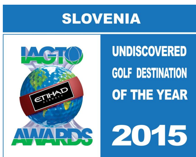
Slika 7. Logotip nagrade za najobetavnejšo golf destinacijo za leto 2015 («Dobrodošli na golf», 2016).

organizatorjev potovanj za golf. Nagrada, ki se podeljuje enkrat letno v okviru Mednarodnega sejma potovalne golfindustrije, se podeljuje golf destinacijam, ki predstavljajo neodkrit biser med svetovnimi golfskimi destinacijami s kakovostno golfsko ponudbo, atraktivnimi golf igrišči in različnimi možnostmi tečajev za začetnike ali naprednejše igralce. Na področju golf turizma je Slovenija prvič resneje nastopila v letu 2012, skupni nastop pod blagovno znamko I Feel Slovenia pa je še v večji meri izboljšal prepoznavnost Slovenije na močnejših mednarodnih trgih. Tujim gostom iz sosednjih držav Italije, Avstrije in Nemčije se v zadnjih letih pridružujejo tudi gostje iz Skandinavskih držav, največ iz Švedske in Finske («Slovenija je najobetavnejša», 2014).