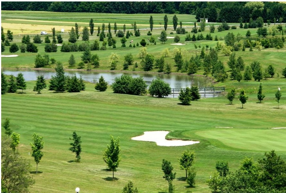
Slika 14. Golf igrišče Livada v Moravskih Toplicah (»Golf igrišče«, 2016).

Ob koncu leta 2013 so v podjetju Sava Turizem, ki je lastnik golf igrišča v Moravskih Toplicah, napovedovali prodajo igrišča za golf v letu 2014. Pri iskanju kupca igrišča so se usmerjali k investitorjem, ki jim je v interesu nadaljnji razvoj golfskega turizma, tako so pogovori o prodaji s potencialnimi vlagatelji že potekali, ampak do dogovora takrat še ni prišlo. Problem pri prodaji lahko nastane tudi zaradi tega, ker Sava ni lastnik vsega zemljišča, saj je del zemljišča v lasti občine (Pojbič, 2013).