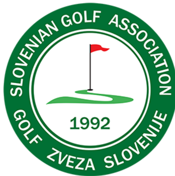
Slika 1. Logotip Golf zveze Slovenije (»Struktura GZS«, 2016).