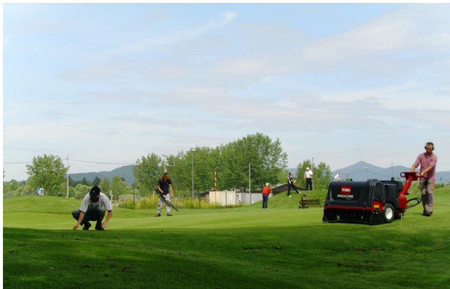
Slika 6. Potek vzdrževanja golfskih igrišč (»ZVGIS«, 2016).

Združenje vsakoletno organizira dva do tridnevne Dneve izobraževanja, kjer poleg priznanih domačih strokovnjakov predavajo tudi različni profesorji iz tujine. Poleg tega sodeluje in se povezuje tudi z različnimi izobraževalnimi ustanovami v Sloveniji in drugimi mednarodnimi združenji. Tako je Združenje od leta 1999 član Federacije Združenj vzdrževalcev golf igrišč Evrope ali FEGGA ter Združenja vzdrževalcev golf igrišč Amerike ali GCSAA. Glavni namen članstva v teh združenjih je izmenjava informacij, znanj, novosti na področju vzdrževanja golf igrišč ter pravilne in varne uporabe fitofarmaceutskih sredstev. V letu 2000 so tako v Združenju sprejeli akt o varovanju okolja, ki ga je izdala FEGGA (Cecelja, 2012). Gorazd Nastran, član uprave FEGGA in bivši vodja komisije za okolje pri Golf zvezi Slovenije, pravi, da je bilo Združenje vzdrževalcev golfskih igrišč Slovenije ustanovljeno z namenom izobraževanja, saj je preko organiziranega združenja lažje pridobiti tuje strokovnjake, profesorje in predavatelje ter tako doseči višji nivo izobraževanja. Zanimanje za izobraževanja iz leta v leto raste, saj je vsako leto več slušateljev, ki prihajajo tudi iz tujine - Avstrije, Italije, Madžarske, Češke in Bosne (Novak, 2004a).