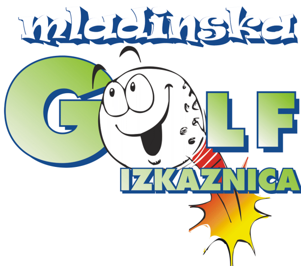
Slika 4. Logotip projekta Mladinska golf izkaznica (»Vsebina«, 2016).