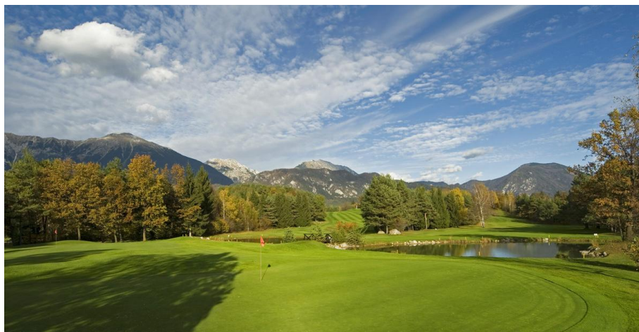
Slika 9. Golf igrišče Bled (»Golf igrišče«, 2016).

Na Bledu skrbijo tudi za varstvo narave in okolja, saj pri vzdrževanju igrišča uporabljajo počasi topna organska mineralna gnojila, ki ustrezajo ekološkemu kmetijstvu (Senčar, 2002c). Poleg tega pa so se pridružili evropskim standardom vzdrževanja golfskih igrišč Committed to Green, ki so zelo zahtevni in v določeni meri celo presegajo standarde, ki jih postavljajo slovenski varuhi narave (Kürner, 2005). Dodatno pa so uredili tudi akumulacijsko jezero in nov namakalni sistem, ki omogoča, da se odvečna voda in deževnica zbirata v jezeru in se tako zagotovi ustrezne količine vode za zalivanje skupno 70 hektarov igrišča (Račič, 2015).