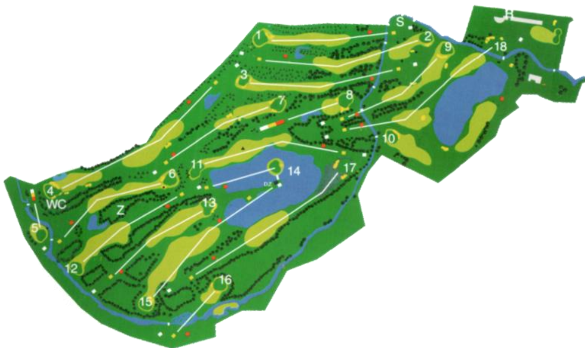
Slika 12. Razporeditev igralnih polj igrišča za golf na Ptujju (»Shema igrišča«, 2016).