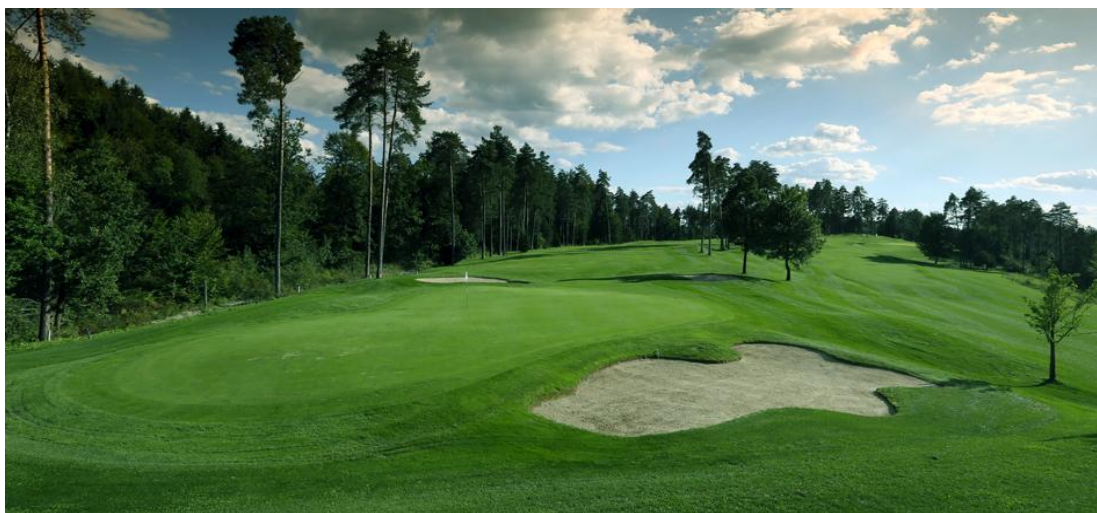
Slika 11. Golf igrišče Arboretum (»Golf – Arboretum«, 2016).

Igrišče v Arboretumu je bilo zgrajeno na površini 28 hektarov, skupna dolžina 9 igralnih polj, ki so nekoliko ožja, je 2750 m in ima par 35 (Kürner, 1998b). Razgiban teren je vzrok za raznolikost stez, dodatno pa igrišče popestrijo tri pretočna jezera in več naravnih biotopov (Škofic, 1996). Na igrišču so postavili tudi klubsko hišico s tremi etažami, v kateri je poleg klubskih prostorov še restavracija, večnamenska dvorana za 100 do 150 ljudi, dva apartmaja, garderobe, shramba in sanitarije. Z zgraditvijo 9 igralnih polj in klubske hišice je bila v Arboretumu končana šele prva faza gradnje igrišča, pripravljeni pa so že bili načrti za prihodnje leto in začetek druge faze gradnje naslednjih 9 lukenj (Kürner, 1998b). Gradnja druge faze se je zaključila leta 2003 in od takrat imajo v Arboretumu golf igrišče z 18 igralnimi polji, s skupnim parom igrišča 71 (»Zgodovina«, 2012).