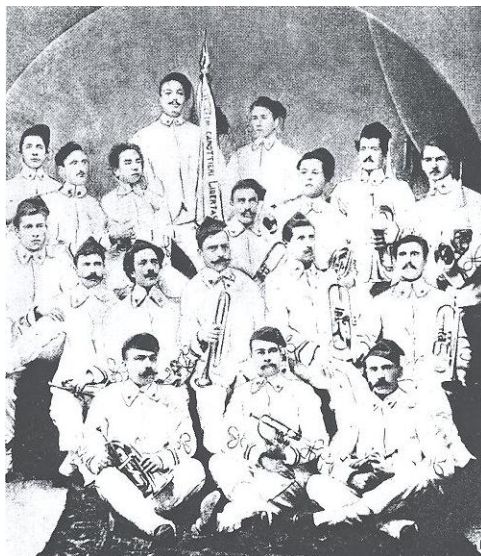
Libertasov orkester fanfar leta 1907

Leta 1907 so v društvu Libertas ustanovili tudi orkester fanfar. Sestavljen je bil iz približno petnajstih glasbenikov. Tako so 5. junija odšli na mestne ulice in z naglimi koraki razveseljevali ljudi po Kopru. Orkester je bil pozneje prisoten na vseh Libertasovih dogodkih (70 anni di vita, 1958).