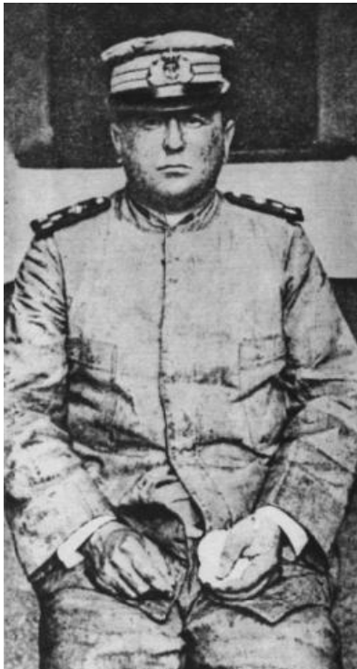
Nazario Sauro (1880–1916)

Društvo Libertas je v tem obdobju povečalo število organiziranih družabnih prireditev. S ciljem ohranjanja prijateljskih vezi članov kluba so se prirejale zabave v Valdoltri in S. Chiari. Intenzivna je bila tudi prej omenjena patriotska aktivnost društva. Ni ga bilo praznika, komemoracije ali zborov nekdanjih vojakov (zelo številnih v tistem času), na katerem ne bi bilo videti Libertasove klubske zastave oziroma plamenca, kateri je sledilo spremstvo veslačev. Po vojni so v Koprskem zalivu na dan 10. avgusta organizirali tudi izhod vseh plovil in položitev lovorjevega venca na obletnico smrtne kazni Nazaria Saura 1 . Komemoracija je hitro postala tradicionalna in leta 1921 je Libertas ob tej priložnosti prevzel slogan »Vedno, kjer koli in predvsem Italijani«, ki je bil izvzet iz Nazarijevega nagovora sinovom v svojem zadnjem pismu oziroma testamentu (70 anni di vita, 1958).