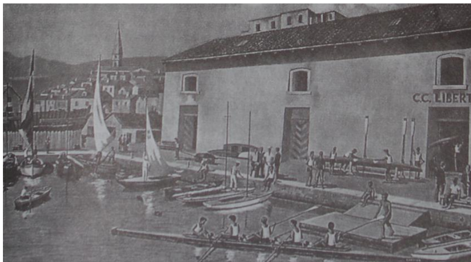
Nov klubski prostor; zgradba stoji še danes in je poimenovana po društvu Libertas