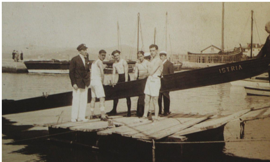
Jola Istria: edini klubski čoln, ki je preстал 1. svetovno vojno