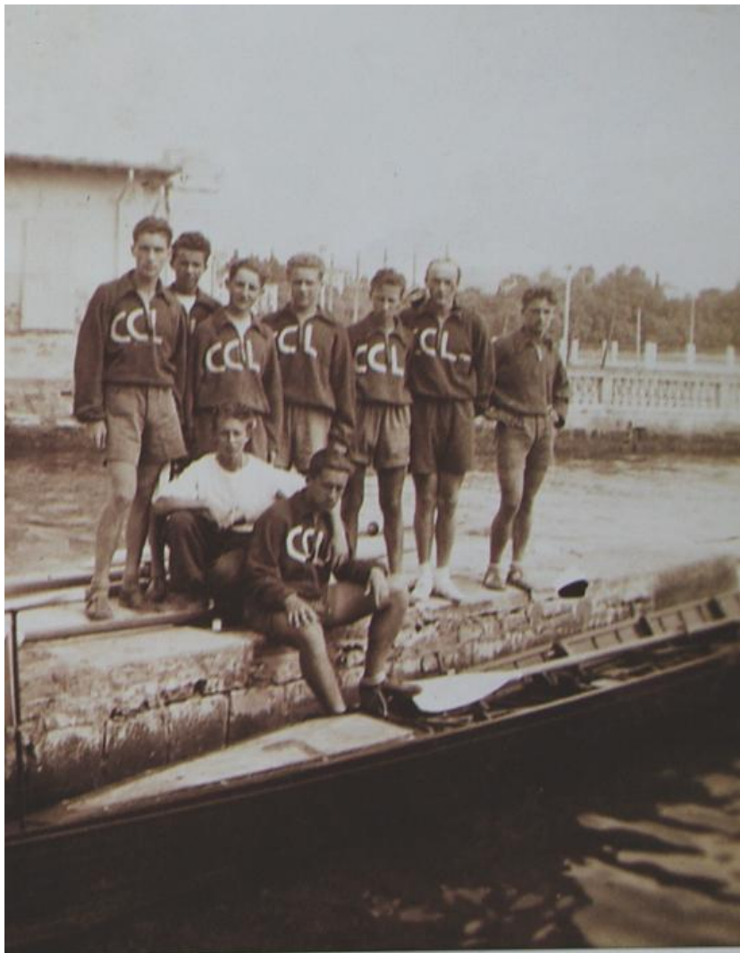
Koprski veslači z osmercem, 10. julij 1941

Naslednje leto se koprski veslači že niso več udeležili regate v Trstu (Il piccolo della sera, 4. september 1939).