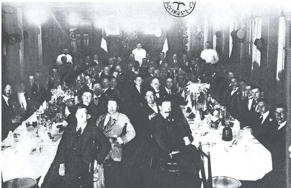
Zadnja večerja koprskih veslačev leta 1914 pred 1. svetovno vojno

Portoroška regata je bila zadnja v tem letu. Napovedano regionalno regato v Poreču so odpovedali. Dogodki, ki so spremenili potek zgodovine, so se dogajali v vse hitrejšem ritmu (70 anni di vita, 1958).