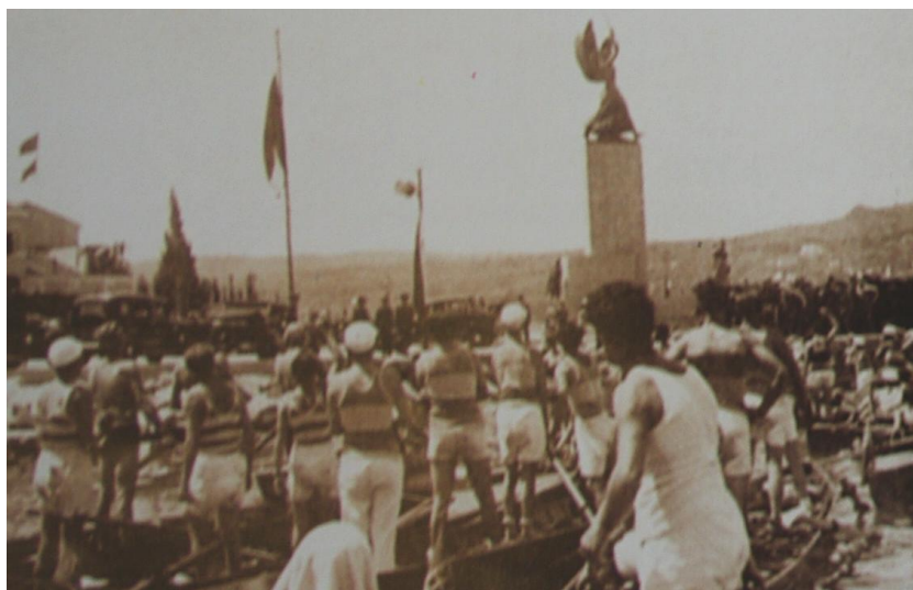
Poklon veslačev spomeniku Nazaria Saura v Kopru

Zelo vesel dan za Libertasovce in vse Koprčane je bil 9. junij 1935, ko so na današnjem Ukmarjevem trgu v Kopru otvorili spomenik Nazariu Sauru. Dogodek je imel toliko večjo težo, saj sta poleg ostalih uglednih oseb na slavnostni dan prišla tudi tedanji italijanski kralj Vittorio Emanuele III. in Benito Mussolini. Ob tej priložnosti se je v Kopru zbralo veliko število obiskovalcev. Samo z območja Istre naj bi jih bilo preko 9.000, kar nekaj pa naj bi jih prišlo še iz Reke, Zadra, Gorice, Benetk, Ancone, Milana ... Poleg dveh posebnih vlakov in čez 20 parnikov, naj bi v mesto prispelo tudi okoli 500 motoristov. Mesto je pri tem dobilo nadvse praznično podobo; hiše so krasile zastave in portreti italijanskega kralja in Duceja. Koprski veslači so pri tem aktivno sodelovali. Ob prihodu ladje so s svojimi čolni na kratki razdalji v Koprskem zalivu pospremili ugledne goste in jih pozdravili s slavnostnimi kriki (Il piccolo della sera, 10. junij 1935). Tega dne je društvo Libertas organiziralo zbor čolnov ob glavnem koprskem pomolu, kjer se je odvijala otvoritev spomenika, katerega se je udeležilo 21 klubov s 148 plovili, od katerih je bilo 55 čolnov na vesla, z 288 veslači. Dodeljena sta bila tudi dva spominska pokala društvom, ki sta se zboru udeležila v največjem številu (70 anni di vita, 1958).