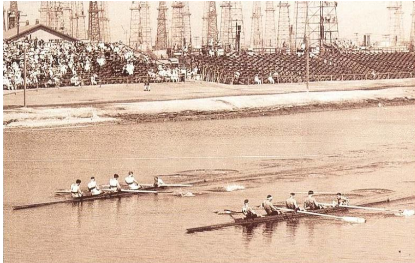
Nemški in koprski čoln v finalu OI meter pred ciljem

končali na drugem mestu, za Nemci, na včerajšnji regati v L. A. Nemčija je progo preveslala v času 7' 19 sek, Libertas v 7' 19 in 1/5 sek. Gledalci so jih aklamirali kot zmagovalcem enake – in tako je tudi prav.« Libertasovci so se le stežka sprijaznili z izgubljenim zmago. Po njihovem mnenju je bil vzrok, ki je vplival na rezultat v finalu, sprememba v taktiki veslanja, katero jim je zastavil selektor reprezentance, brez nikakršnega tehtnega razloga (Il Piccolo, 15. september 1932).