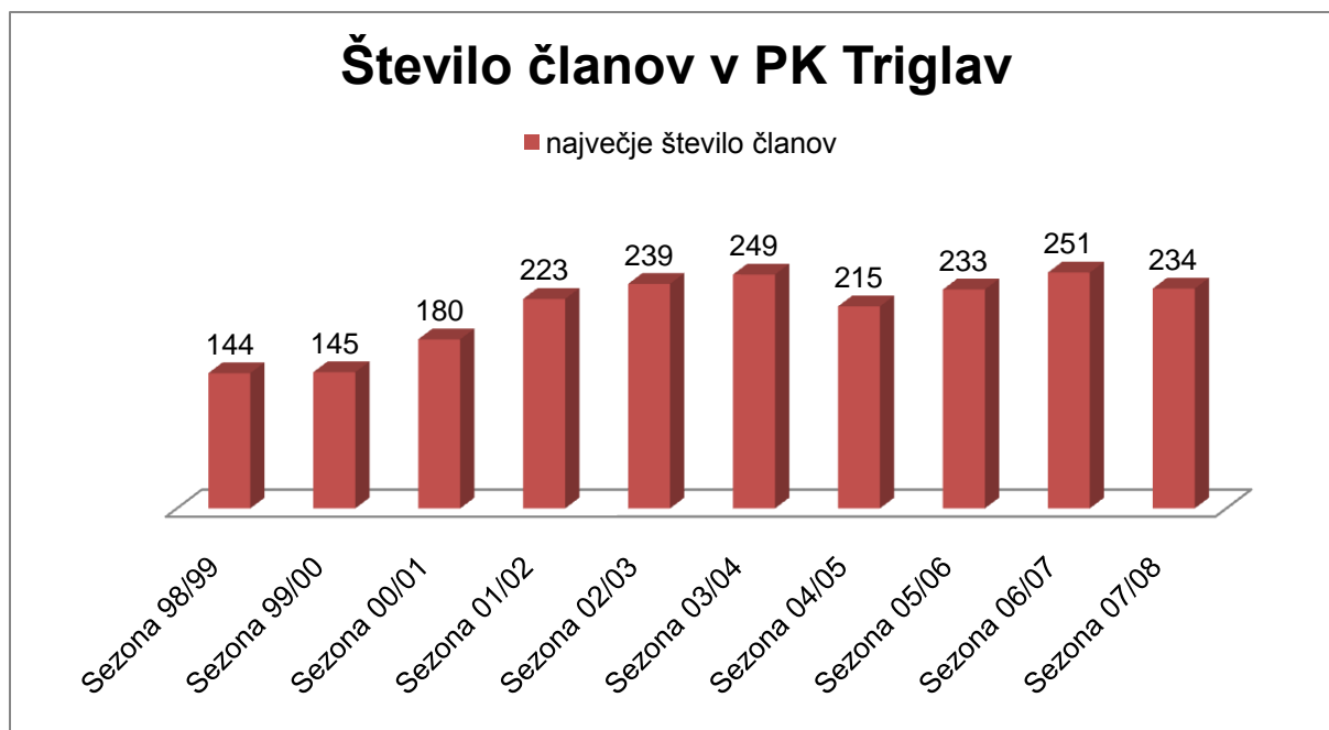
Slika 12. Grafični prikaz števila članov v PK Triglavu