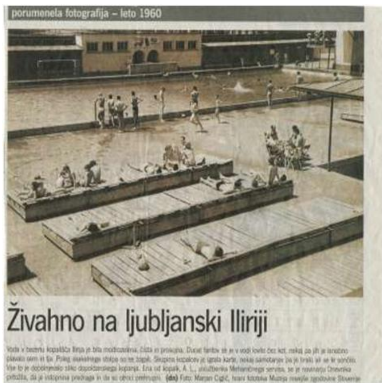
Slika 3 - Kopališče Ilirija

Leta 1935 je D. Ulaga napisal knjižico Kravl, prsno in hrbtno plavanje , ki je bila prva strokovna publikacija na tem področju v slovenščini.