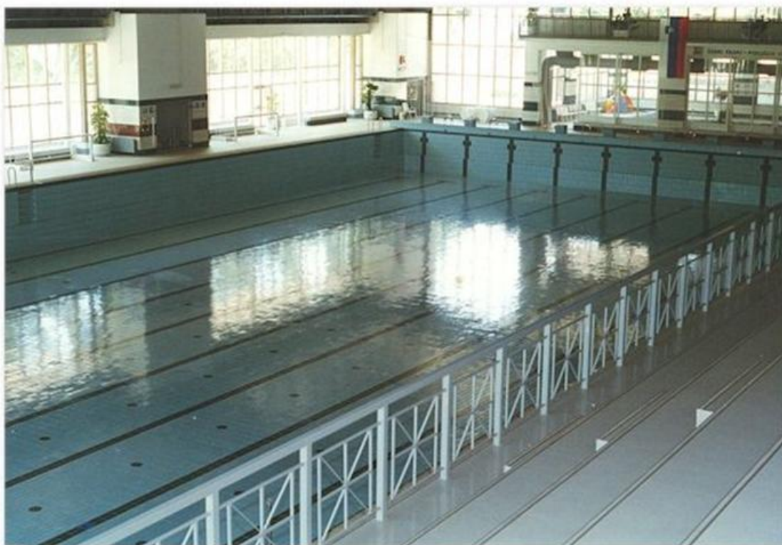
Slika 7 - Pokriti olimpijski bazen v Kranju