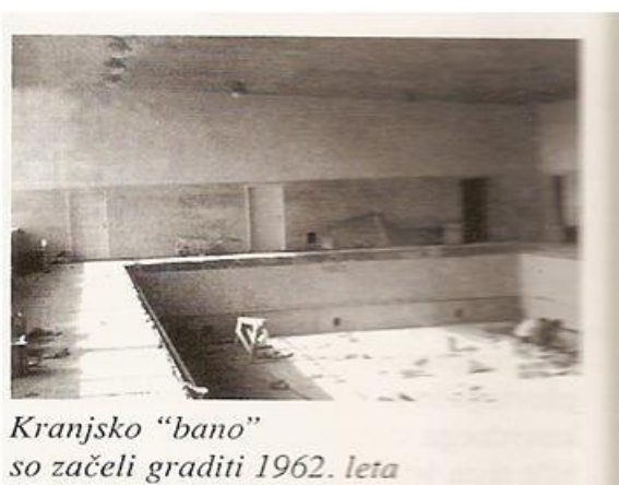
Slika 4 - Kranjski pokriti bazen (Bregar, 1998)

Leta 1962 so začeli graditi Kranjsko »bano«, zimski pokriti 25 metrski bazen. Največ zaslug za izgradnjo pokritega zimskega bazena ima gonilna sila Kranjskega plavanja Božo Trefalt. Bazen je bil dograjen leta 1963 in je imel ob otvoritvi na južni strani tudi tribune za okoli 300 gledalcev, ki pa so jo zaradi pomanjkanja prostora in slabega prezračevanja kmalu odstranili. Med gradnjo zimskega bazena pa so na letnem bazenu uredili ogrevanje! V teh letih je bilo v Kranju res veliko narejenega za plavanje.