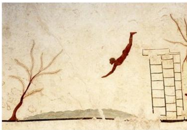
Slika 1 - Plavanje v stari Grčiji

Prvo obdobje razvoja plavanja je bilo najdaljše od prvega spoznanja človeka z vodo do zavračanja potrebe po uporabi vode celo za higienske potrebe. Najdeni podatki kažejo, da so plavanje poznale tudi najstarejše človekove kulture, celo v prazgodovini. Človek se je naseljeval na obalah, močvirnatih plitvinah, kjer je postavil kolišča in iskal hrano tudi v vodi, saj je bil ribolov manj utrudljiv kot lov. Tako je bil prisiljen obvladovati spretnost gibanja v vodi, torej plavanja.