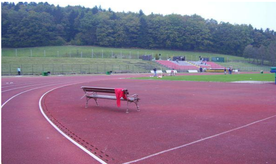
Slika 3: Stadion Portoval.

Na stadionu Portoval vadijo atleti obeh novomeških klubov, večino treninga tu opravi tudi AS Novoles. Tu trenirajo tudi nogometaši novomeškega nogometnega kluba, poleti pa tu opravijo kondicijsko pripravo tudi ostali športniki (košarkarji, športniki borilnih veščin, ipd.). Rekreativni tekači tu združijo vadbo na stezi s tekom v naravi, ki ga nudi okoliški gozd.