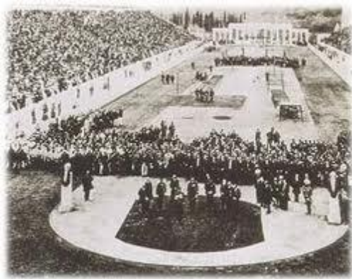
Slika 1: Otvoritev OI 1894 v Atenah.

Leta 1912 je 17 držav ustanovilo IAAF (mednarodno atletska zveza) z željo po krovni organizaciji, ki bi poenotila atletske program, rekvizite in rekorde. S tem je bila atletika formalizirana kot športna panoga s krovno panožno zvezo, ki danes šteje preko 200 članic. (Pavlin, 2005).