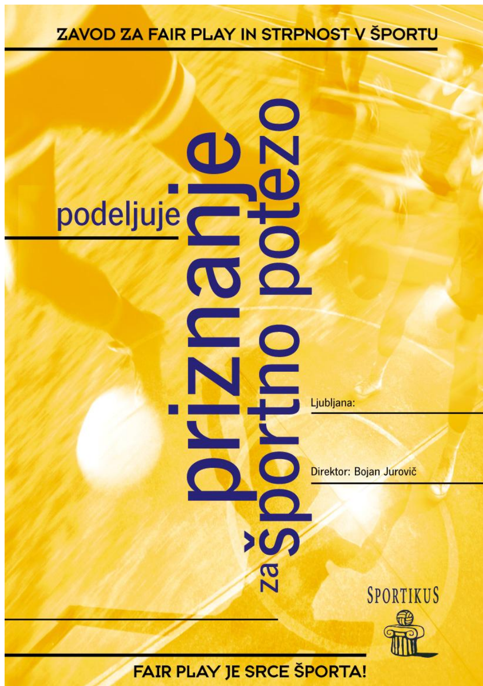
Slika 9: Priznanje za športno potezo. Športniki, ki niso izbrani za Športno potezo meseca, prejmejo priznanje za Športno potezo.

Predlogi se načeloma ne prenašajo na naslednji mesec, razen če drugače odloči komisija. Predlogi so razdeljeni v dve kategoriji (kategorija do osemnajst ter kategorija nad osemnajst let). Priznanje je podeljeno trem izbranim predlogom iz vsake kategorije.