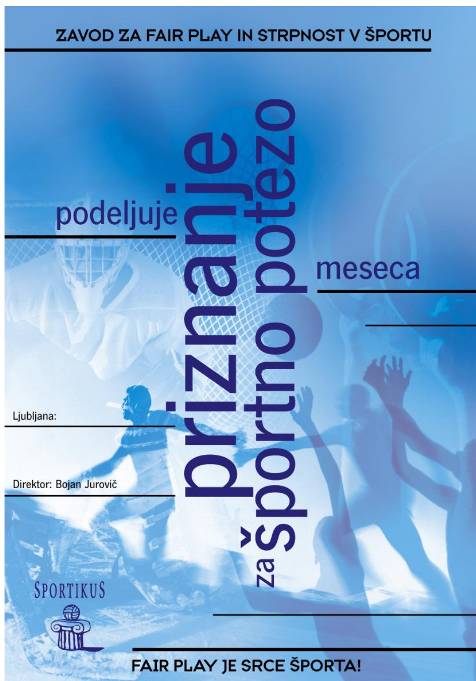
Slika 8: Športniki, ki so izbrani za potezo meseca, prejmejo modro priznanje športna poteza meseca.

medtem ko vsi ostali, ki zadovoljujejo kriterijem, prejmejo priznanje rumene barve in jih v kategoriji športna poteza najdemo pod ostale nagrade.