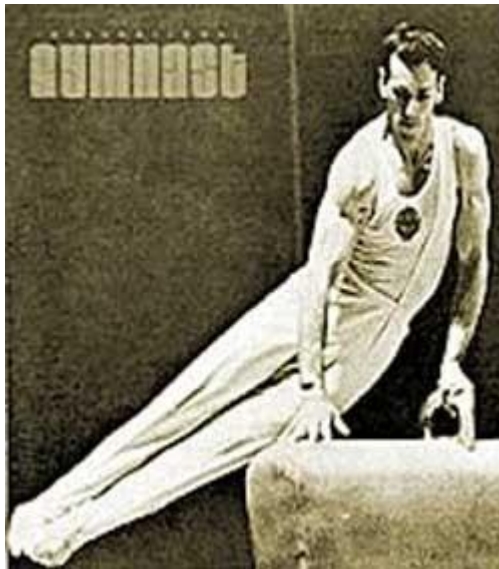
Slika 2: Miroslav Cerar na olimpijskih igrah leta 1968, ki so se potekale v Ciudad de México (Jugoslavija – 1968 dalje, 2009).

Cerar je v finalu na bradlji zasedel drugo mesto, pred njim je bil le Boris Sahlin. Po mnenju mnogih je bila Cerarjeva vaja nepravilno ocenjena in ko je Sahlin končal vajo ter so se na semaforju pokazale številke, se je vsul plaz protestov z vseh strani. Cerarja so vsi pozivali k protestu, sam pa je le mirno odkorakal do tekmeca in mu športno podal roko. Po protestu, ki ga je spremljalo glasno žvižganje in je trajalo kakšnih 25 minut, so sodniki prvič v zgodovini gimnastičnih tekmovanj spremenili svoje ocene in zmagovalec je postal Miroslav Cerar (Miroslav Cerar predlagan za prestižno nagrado MOK za fair play in strpnost!, 2005).