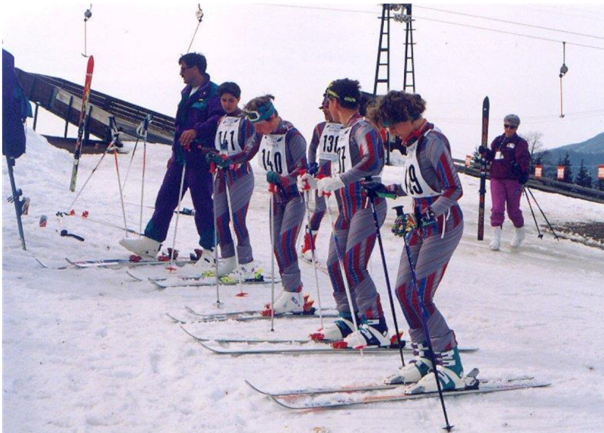
Slika 6: Schladming 1993

Na Sliki 6 so nekateri naši tekmovalci v alpskem smučanju.