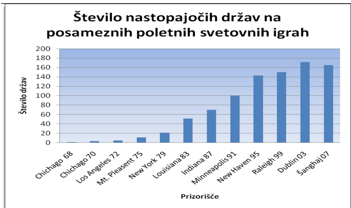
Slika 2: Število nastopajočih držav na posameznih poletnih svetovnih igrah.

Na Sliki 1 je prikazano število tekmovalcev na posameznih poletnih svetovnih igrah.