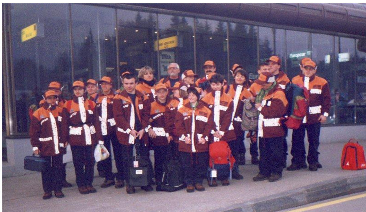
Slika 8: Toronto 1997

V Tabeli 13 so navedeni vsi slovenski tekmovalci v Torontu 1997.