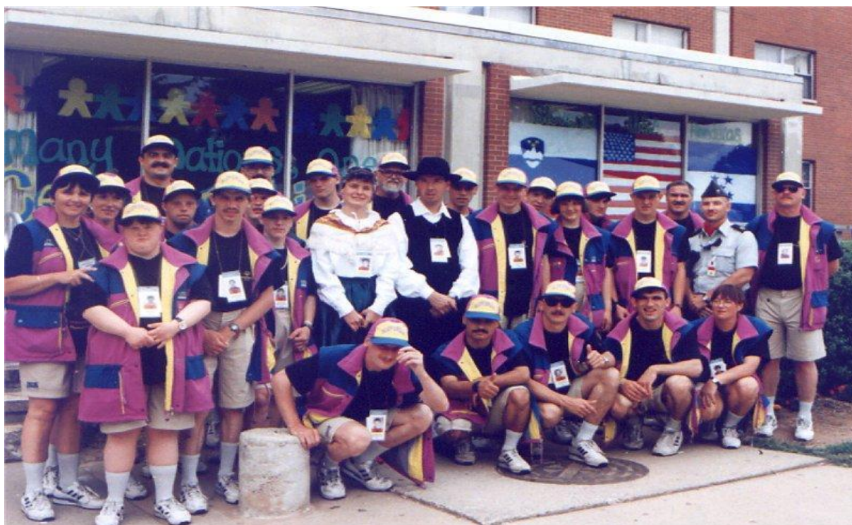
Slika 7: New Heaven 1995

Na Sliki 7 je prikazana slovenska delegacija na igrah v New Heavnu 1995.