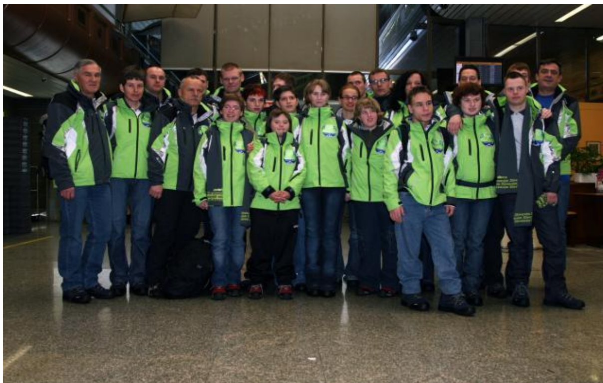
Slika 10: Boise 2009

V Tabeli 37 so navedeni vsi slovenski tekmovalci v Boisu 2009.