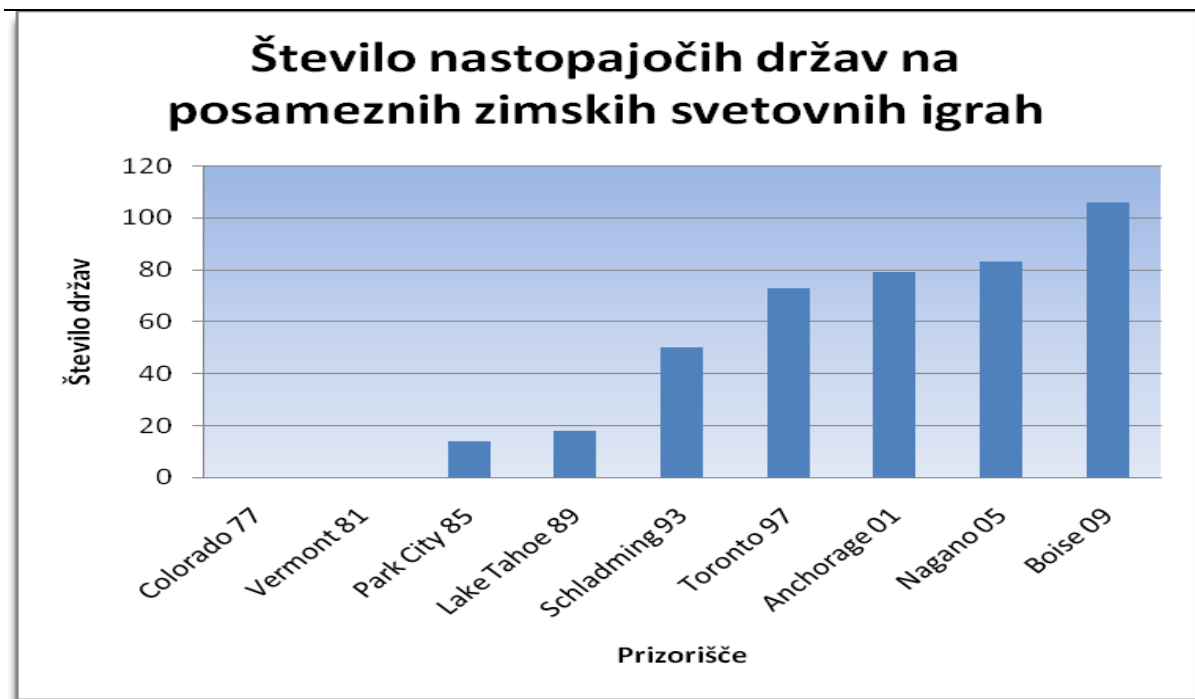
Slika 4: Število nastopajočih držav na posameznih zimskih svetovnih igrah.

Na Sliki 3 je prikazano število tekmovalcev na posameznih zimskih svetovnih igrah.