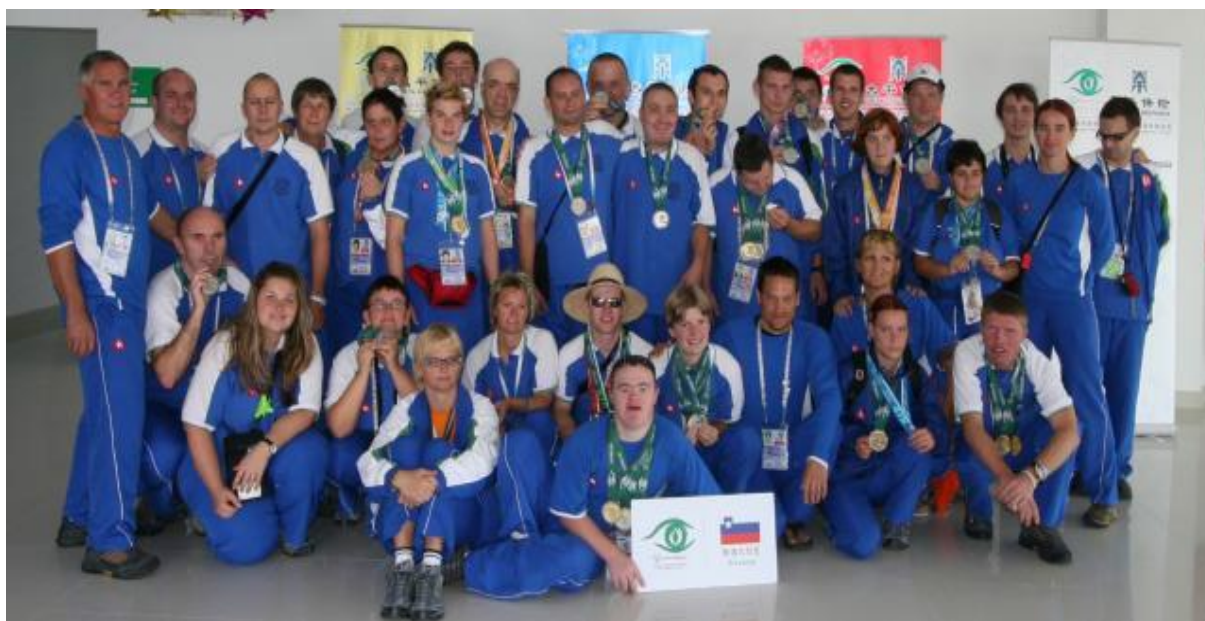
Slika 9: Šanghaj 2007

Slika 9. prikazuje slovensko delegacijo v Šanghaju 2007