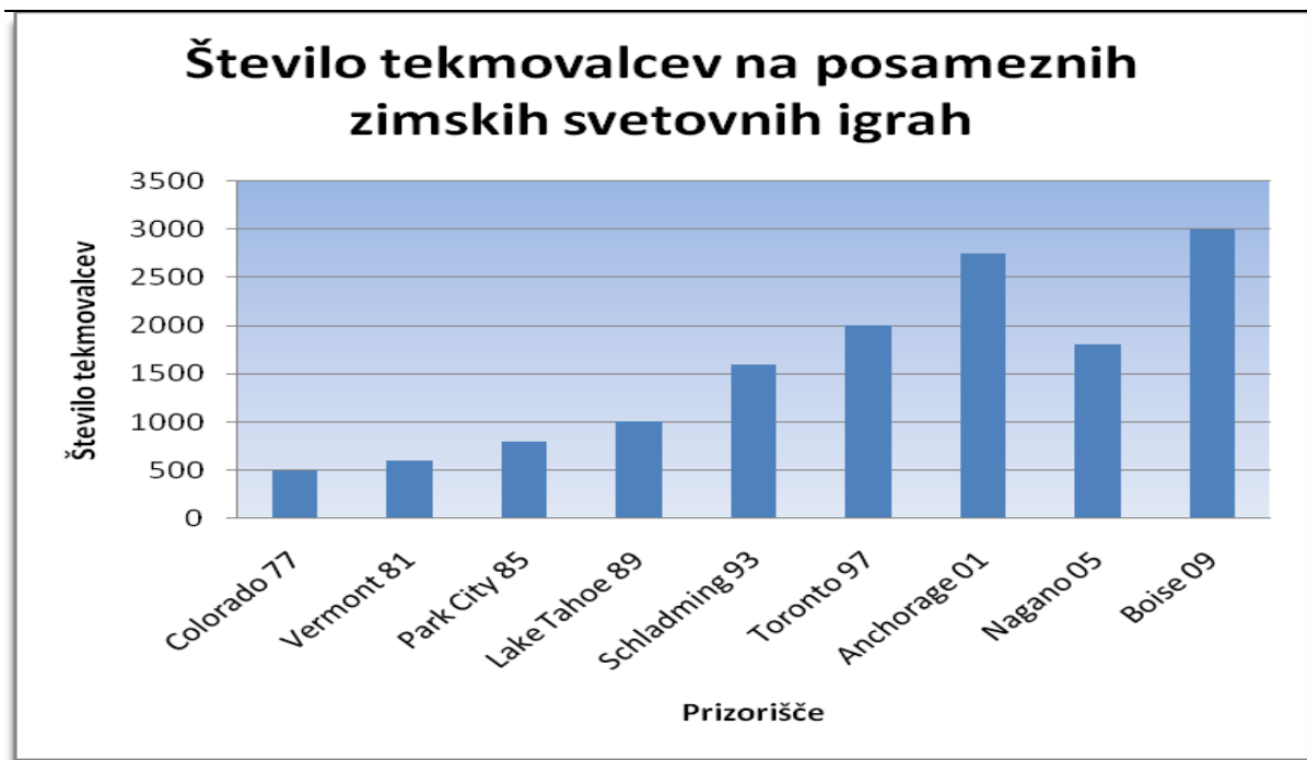
Slika 3: Število tekmovalcev na posameznih zimskih svetovnih igrah.

V Sliki 2 je prikazano število nastopajočih držav na posameznih poletnih svetovnih igrah.