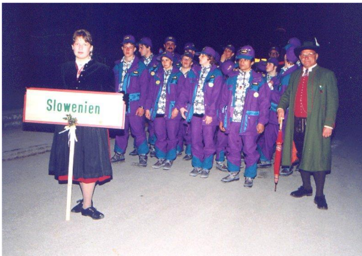
Slika 5: Schladming 1993.

Na Sliki 5 je predstavljena slovenska delegacija v Schladmingu 1993.