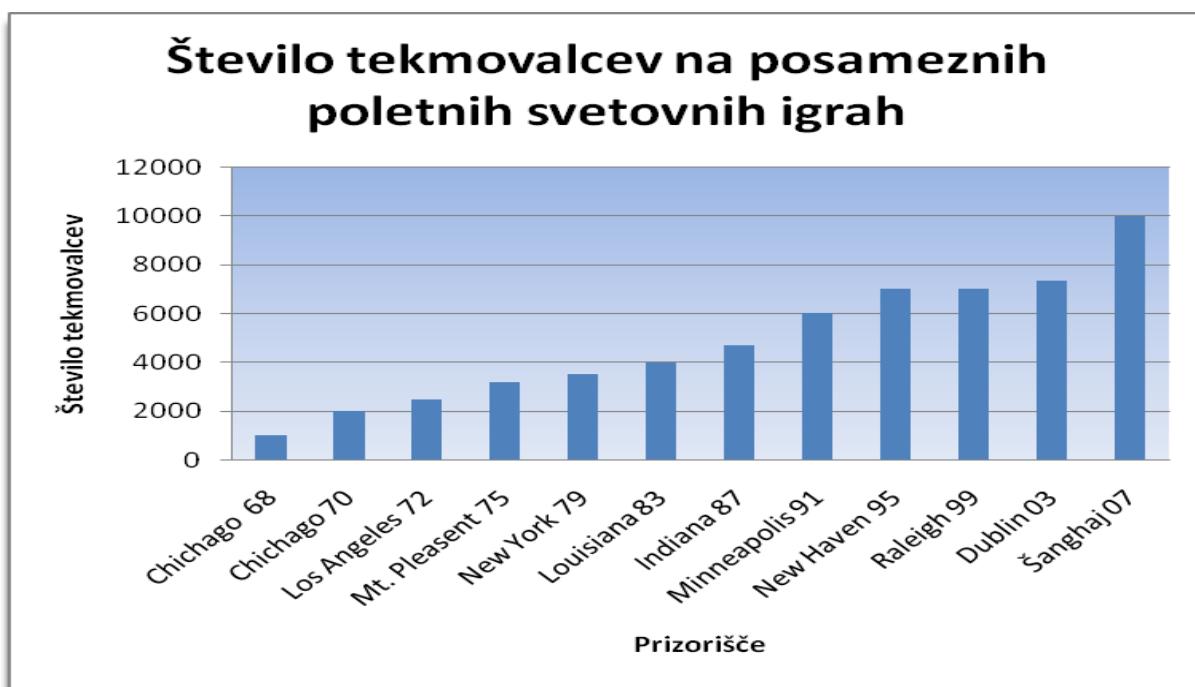
Slika 1: Število tekmovalcev na posameznih poletnih svetovnih igrah.

Na Sliki 1 je prikazano število tekmovalcev na posameznih poletnih svetovnih igrah.