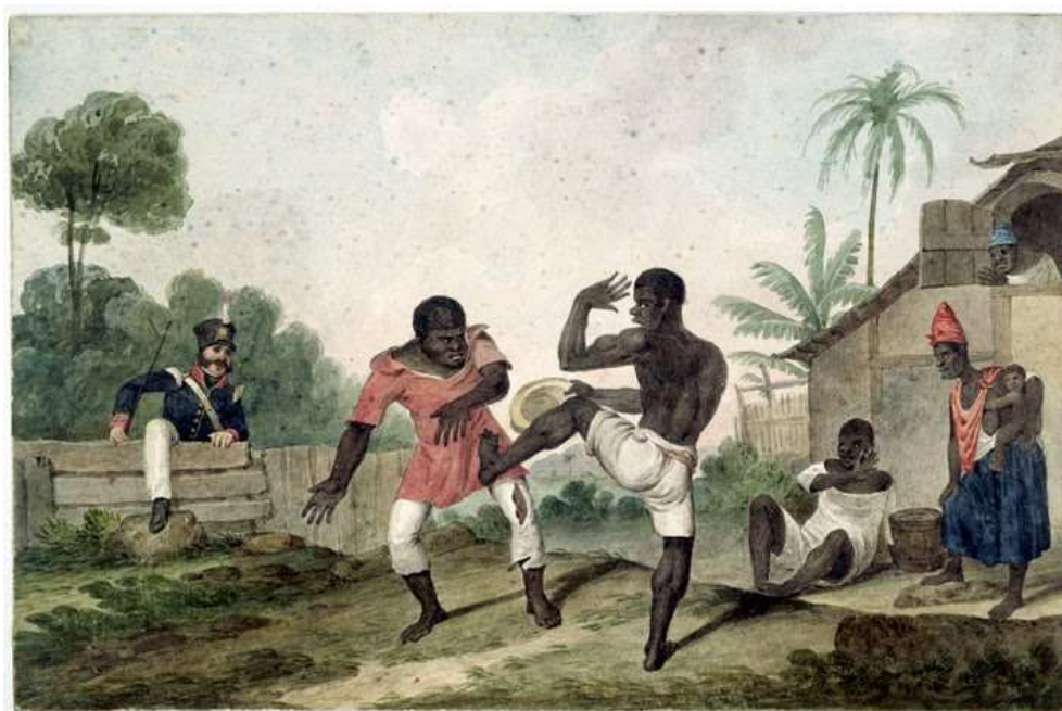
Slika 3: »Negros fighting, Brazil« (Črnca v borbi, Brazilija), slika avtorja Augustusa Earla iz leta 1924 (Augustus Earle, Capoeira, 2011)

Soares (2001, v Assunção, 2005) navaja, da je v tem času več kot četrtnina aretiranih zaradi capoeire s seboj nosila orožje. Afričani bi naj po navadi nosili navadne nože, medtem ko je