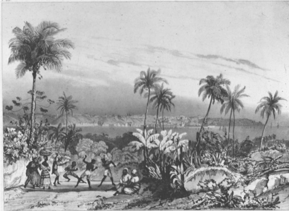
Slika 4: »São Salvador«, slika avtorja Johanna Moritza Rugendasa (Die Rugendas Gemälde, 2011)

capoeira, čeprav v opisu ne uporabi tega izraza. V dnevniku iz istega leta je mogoče zaslediti tudi opis inštrumenta berimbau . Ker slednjega nikjer ne povezuje s plesno-borilno aktivnostjo črncev, je mogoče sklepati, da takrat med njima še ni bilo povezave (Assunção, 2005; Talmon-Chvaicer, 2008).