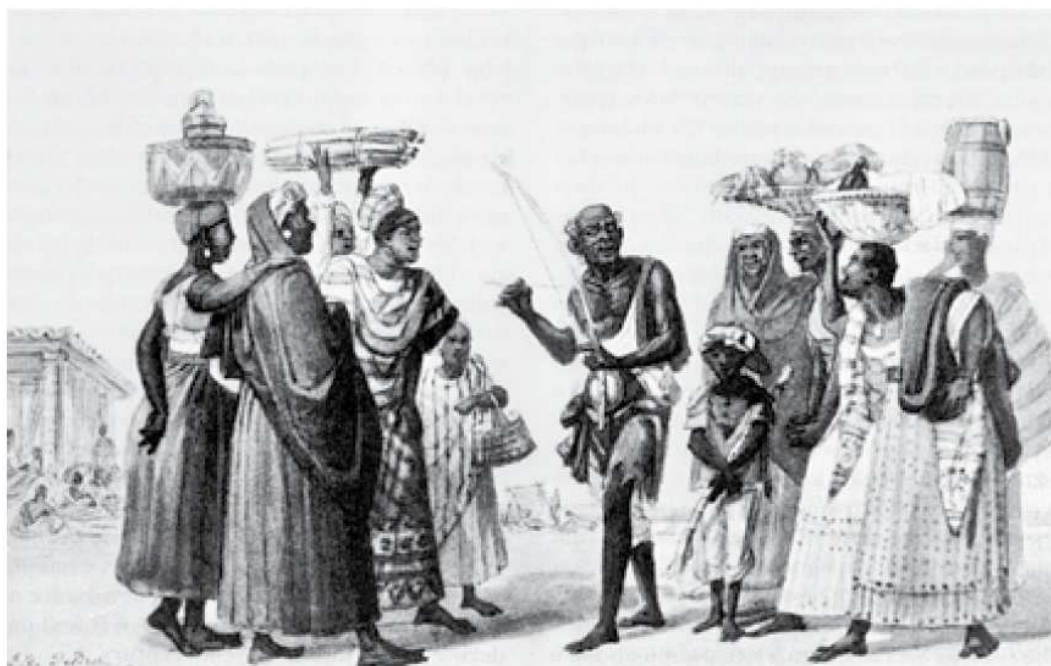
Slika 5: »Joueur d'Urucungo« (Igralec na Urucungo), slika avtorja Jean-Baptista Debreta iz leta 1826 (Debret, 1954, v Talmon-Chvaicer, 2008)

Fu-Kiau (2000, v Talmon-Chvaicer, 2008) navaja, da je berimbau soroden s kongo-angolskim inštrumentom lungungu , ki je spremljal igro kipura 26 . Opisan je kot inštrument z eno struno in zvočno škatlo iz buče. Henrique Augusto de Carvalho v knjigi o ljudstvu Lunda iz leta 1890 opisuje berimbau podoben inštrument, poznan kot rucumbo . Sestavljen je iz strune, napete čez leseni lok, na enem koncu je na struno pritrjena buča. Podoben inštrument je možno zaslediti v virih o Braziliji v zgodnjem 19. stoletju, kjer ga Debret (Slika 5) označuje kot urucungo , Henry Chamberlain (Slika 6) pa kot madimba lungungu (Talmon-Chvaicer, 2008).