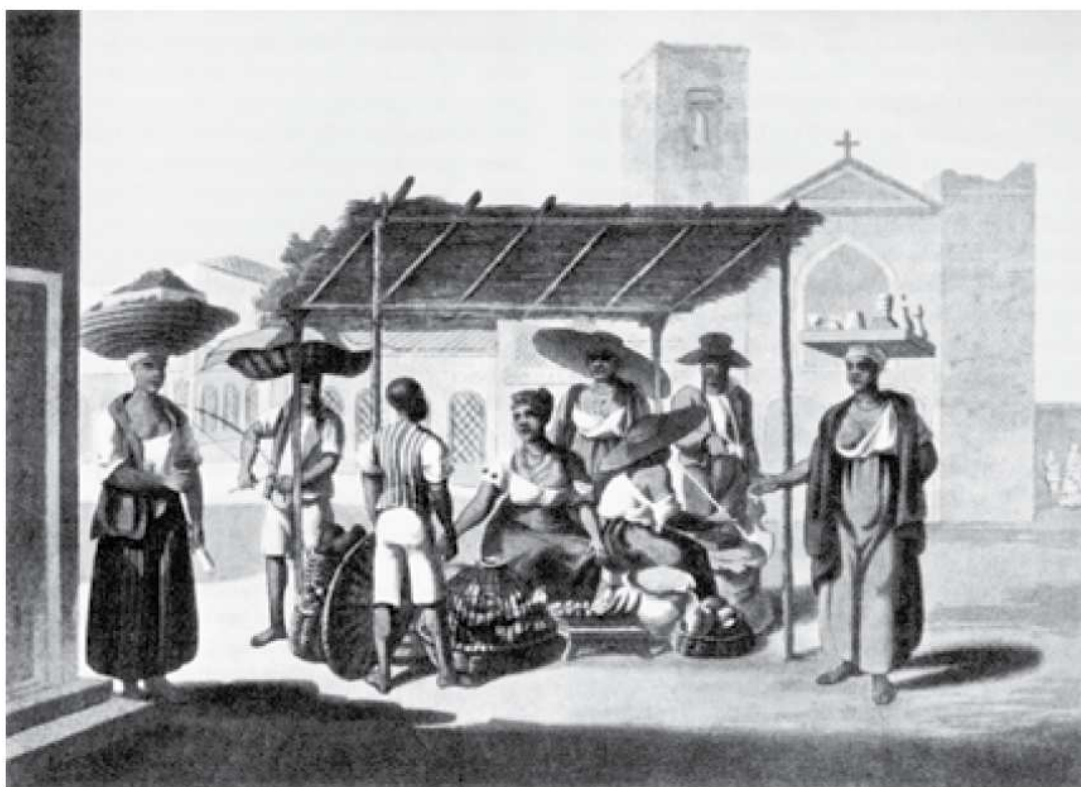
Slika 6: Črnc, ki igra na mandingo lungungu , slika iz zbirke » Vistas e costumes de cidade e arredores do Rio de Janeiro « (Vtisi in navade v mestu in soseskah Rio de Janeira) avtorja Henry Chamberlaina iz leta 1819 (Chamberlin, 1943, v Talmon-Chvaicer, 2008)

Razpoložljivi viri ne povezujejo berimbaua s capoeiro, vsaj ne do tretje četrtine dvajsetega stoletja. Sliki Debreta in Chamberlaina upodabljata moške, ki ga igrajo v popolnoma drugem socialnem kontekstu (Talmon-Chvaicer, 2008).