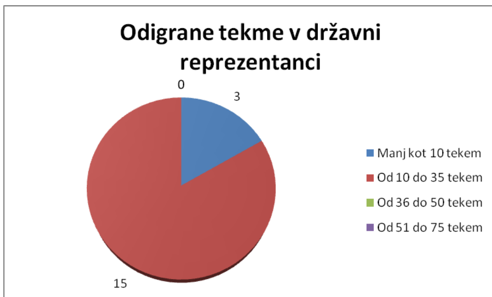
Slika 4. Odigrane tekme v državni reprezentanci.

Osnovni podatki obsegajo tudi njihovo dosedanjo udeležbo na tekmah v dresu z državnim grbom. Ker se ženski nogomet šele razvija in je reprezentanca še dokaj mlada, sem predvidevala, da udeležba ne bo presegala 35 tekem na določeno igralko, a vseeno jih je kar 15, ki so odigrale že več kot 10 tekem in le 3, ki so jih odigrale manj kot 10.