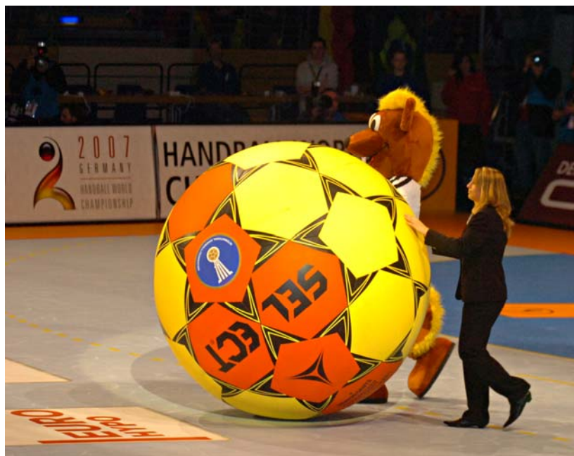
SLIKA 13: Na SP v Nemčiji je bilo obilo zabavnih in atraktivnih dogodkov

Slovenski rokometaši so v zelo podobnem drugem polčasu nazadnje vodili v 36. minuti (20 : 19), nato pa bolj ali manj vseskozi v rezultatu zaostajali za reprezentanco Madžarske. Ob bolj zbrani igri bi si pred odločilnimi trenutki tekme lahko priigrali boljše izhodišče, toda ponovile so se napake iz minulih dvobojev, predvsem slaba je bila priprava in realizacija zaključnih strel (12/21 izpred črte 6 metrov). V zadnjih dveh minutah tekme so naši zaigrali neorganizirano: prvo njihovo napako je v 59. minuti iz hitrega nasprotnega napada izkoristil Csaba Tombor in svoje soigralce popeljal v vodstvo s 32 : 33. V zadnjem slovenskem napadu je strel Miladina Kozline madžarski vratar Puljezevič zaustavil, odločilen zadetek pa je trideset sekund pred koncem dvoboja dal Diaz (32 : 34). Matjaž Brumen, z dvanajstimi goli najbolj učinkovit strelca dvoboja (12/18), je le trenutek kasneje znižal na 33 : 34, v zadnjem napadu pa so Madžari zadržali žogo v svojih rokah. Kljub porazu smo si priborili 10. mesto, ki je doslej naša najboljša uvrstitev na svetovnih prvenstvih.