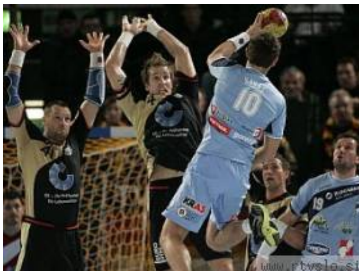
SLIKA 14: Obramba nemške reprezentance je na tem SP delovala zelo dobro

Za model igre slovenske članske reprezentance na SP v Nemčiji lahko ugotovimo, da je bil primerljiv z najuspešnejšimi reprezentancami sveta in ni kazal bistvenega odstopanja od modelov nasprotnih ekip.