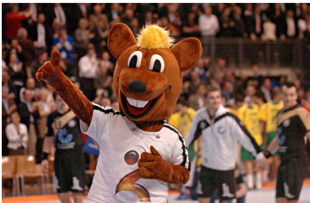
SLIKA 1: Uradna maskota SP v Nemčiji 2007