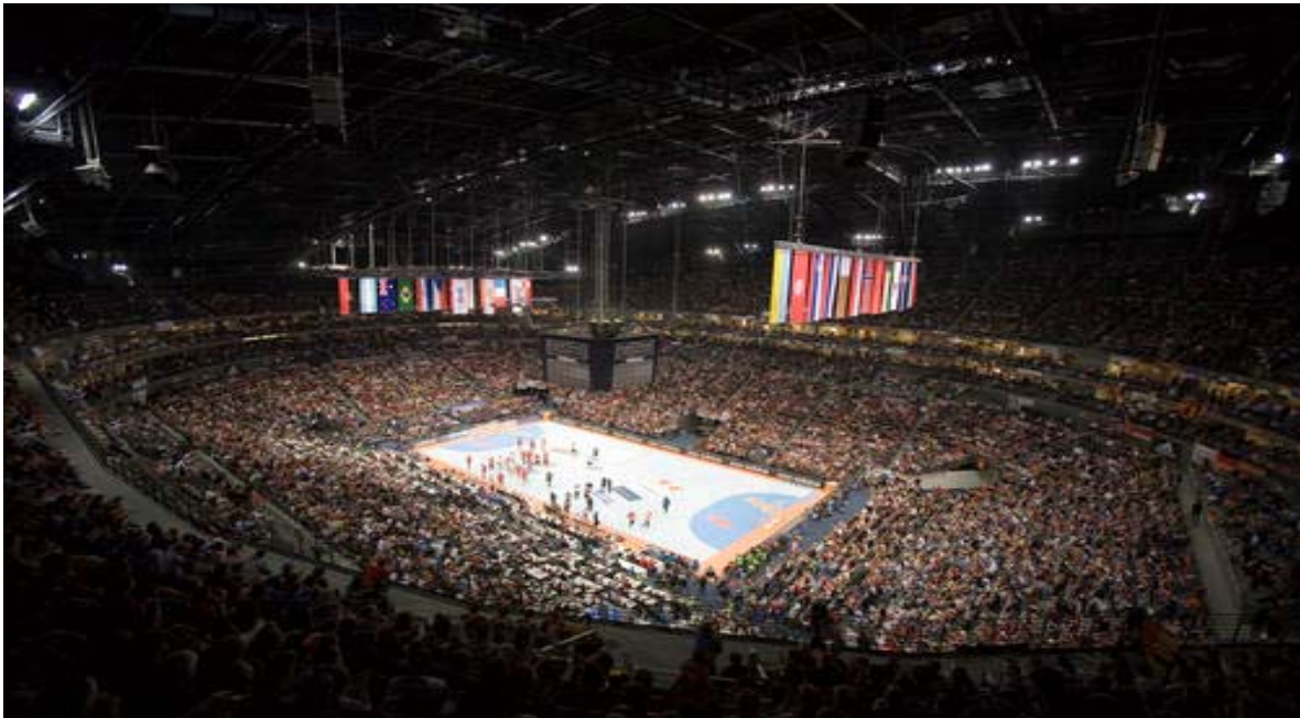
SLIKA 2: V dvoranah na SP v Nemčiji 2007 so dosegali rekordne obiske

Od osamosvojitve leta 1991 se je naša moška rokometna reprezentanca že kar trdno umestila v rokometni zemljevid tako v evropskem kot tudi svetovnem merilu. Po prvih uspehih na Sredozemskih igrah leta 1993, ko smo osvojili bron, in najodmevnejšem 2. mestu na evropskem prvenstvu v Sloveniji je sledilo 10. mesto na svetovnem prvenstvu v Nemčiji, ki je naša najboljša uvrstitev na svetovnih prvenstvih.