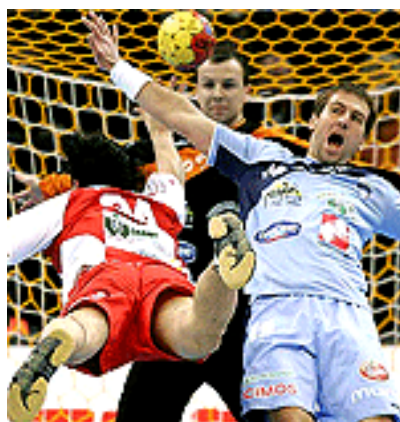
SLIKA 12: Slovenija – Madžarska

Reprezentanca Madžarske je zbrala 19 asistenc, reprezentanca Slovenije pa 4 manj. Obe ekipi sta naredili enako število tehničnih napak (15). Naš nasprotnik je uspel 2-krat blokirati naše strele, naši tekmovalci pa njihovih nikoli. Enako je bilo pri odvzetih žogah, kjer so Madžari uspeli odvzeti 2 žogi, ekipa Slovenije pa nobene.