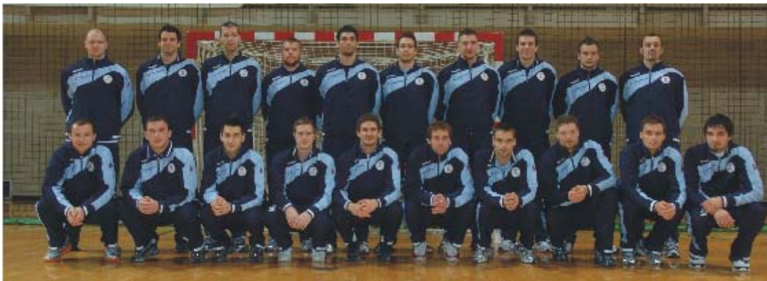
SLIKA 4: Moška članska reprezentanca Slovenije ( www.rokometna-zveza.si )

Analizirali bomo posamezne tekme, in sicer tako igro reprezentance kot tudi njenih tekmecev. Nadalje bomo analizirali ekipe kot celoto in posamezne igralce na določenih tekmah. Osredotočili se bomo na vse pomembnejše parametre, ki ilustrirajo tekmovalno učinkovitost: absolutno in relativno učinkovitost v napadu, absolutno in relativno učinkovitost v obrambi ter absolutno in relativno učinkovitost vratarjev. Seveda pa bomo največ pozornosti namenili analizi igre slovenske moške rokometne reprezentance na SP v Nemčiji 2007.