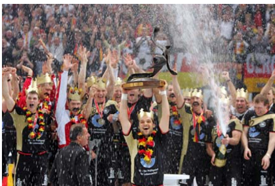
SLIKA 6: Nemčija je na tem svetovnem prvenstvu osvojila zlato medaljo

Kazni si sledijo takole: OPOMIN, IZKLJUČITEV ZA DVE MINUTI, DISKVALIFIKACIJA in IZKLJUČITEV DO KONCA TEKME. Kazni se izrekajo zaradi prekrškov v odnosu do nasprotnika ali nešportnega obnašanja. Po tretji izključitvi za dve minuti, je igralec diskvalificiran in mora zapustiti tudi klopi za rezervne igralce. (Kotnik, 1999)