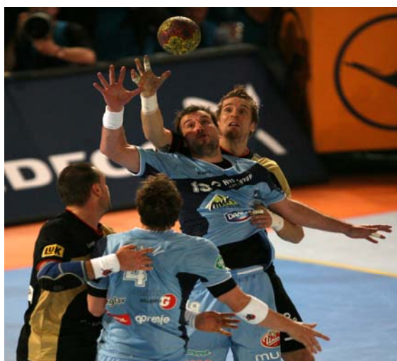
SLIKA 8: Boj za žogo